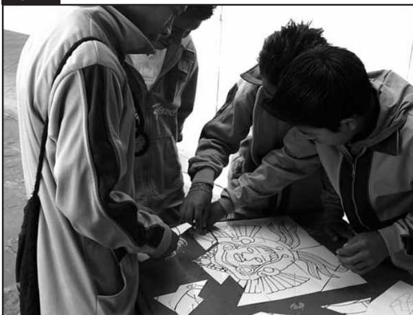
Figura 5. Actividades del taller infantil.

Asimismo, el cerro forma parte de una delimitación geográfica natural del valle de Tenancingo, que ha resultado propicio para el desarrollo de actividades turísticas ofertadas en la región como es el vuelo en parapente. Actualmente hay una demanda turística en el cerro debido a esta actividad turística, que ha puesto en contacto al público asistente con los motivos arqueológicos. La vegetación, el