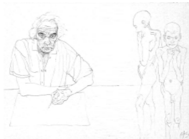
Figura b. El espejo, lápiz sobre papel, 56 x 76 cm, 1998

Si queremos establecer una poética, hasta hoy, y frente al gran proyecto del mural del Teatro Cervantes de Buenos Aires, podemos afirmar que el lenguaje de Carlos Alonso alcanza una contundencia figural. Despliega distintas prácticas con igual eficacia: la