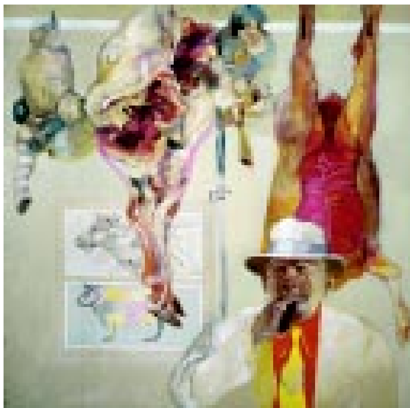
Carne fresca, 1972