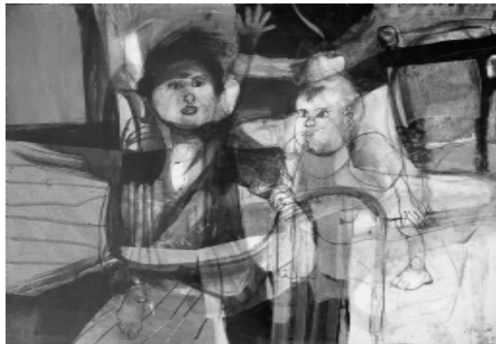
Aquí no hay luz , collage, 1963

Con pan y con trabajo , 1968. Años más tarde el collage persiste transformado en una escena enmarcada