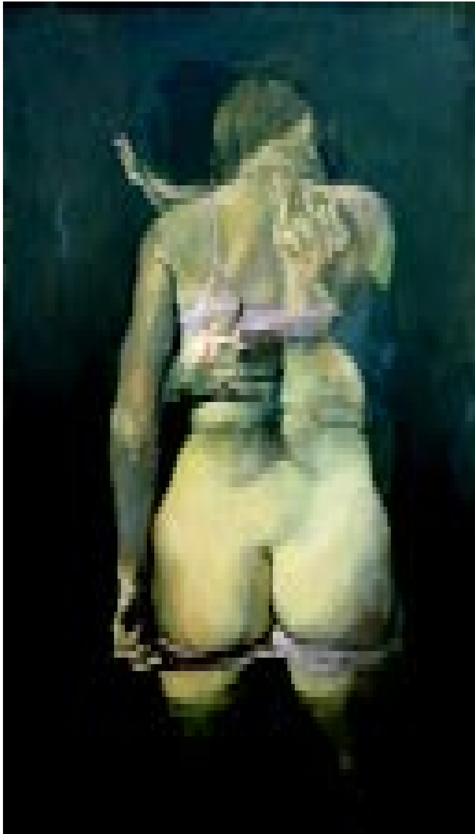
El abrazo, 1983