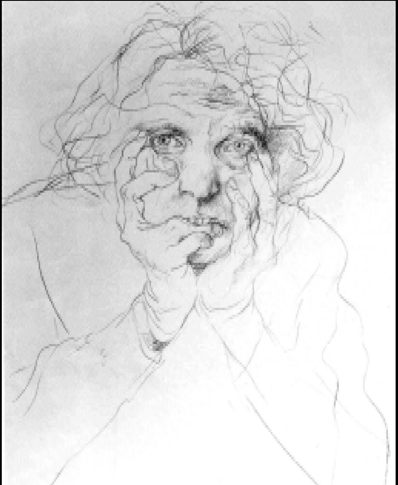
Figura a. El espejo, lápiz, 31 x 23,5 cm, 1979