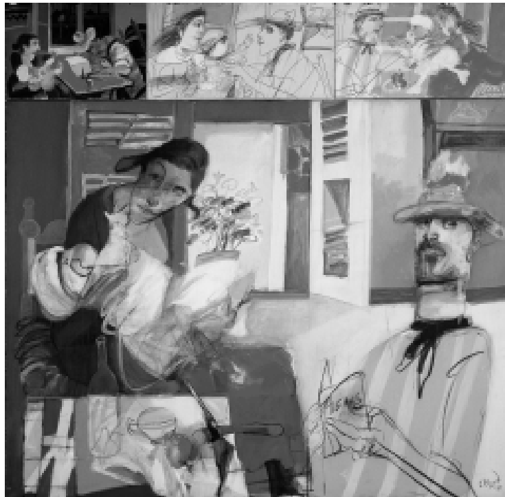
Con pan y trabajo, collage, 1968

En 2004 la presencia del talento creador de Carlos Alonso es contundente. Un despliegue de exhibiciones y proyectos se suceden en distintos ámbitos. En la