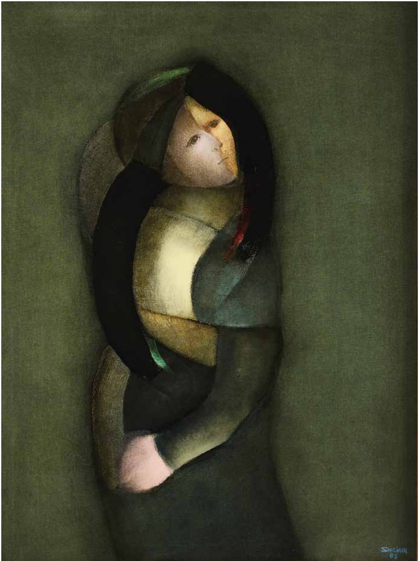
Serie de imágenes , óleo sobre tela, 1985 | 150 x 120 cm ALFREDO SINCLAIR | FUNDACIÓN OLGA SINCLAIR (PANAMÁ)