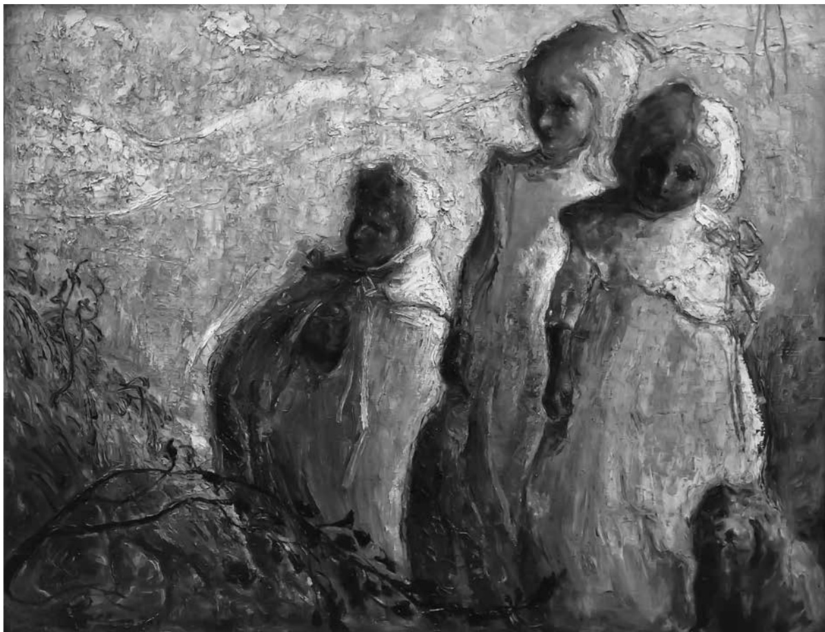
Niño , óleo sobre tela, 1938 | 95 x 123 cm

En la obra de Fromanger, por ejemplo, su “escándalo” u “ofensa” es producir un acontecimiento-imagen en medio de nuestra cultura de la imagen, una imagen “sin contenido” o “significado” que elude la descripción y cuya verdad descansa, en cambio, en su multiplicidad abierta, su iluminación de “multiplicidad en sí misma”. Esto es lo que Foucault identifica como la imagen de la modernidad, la manera en que ésta rompe con las