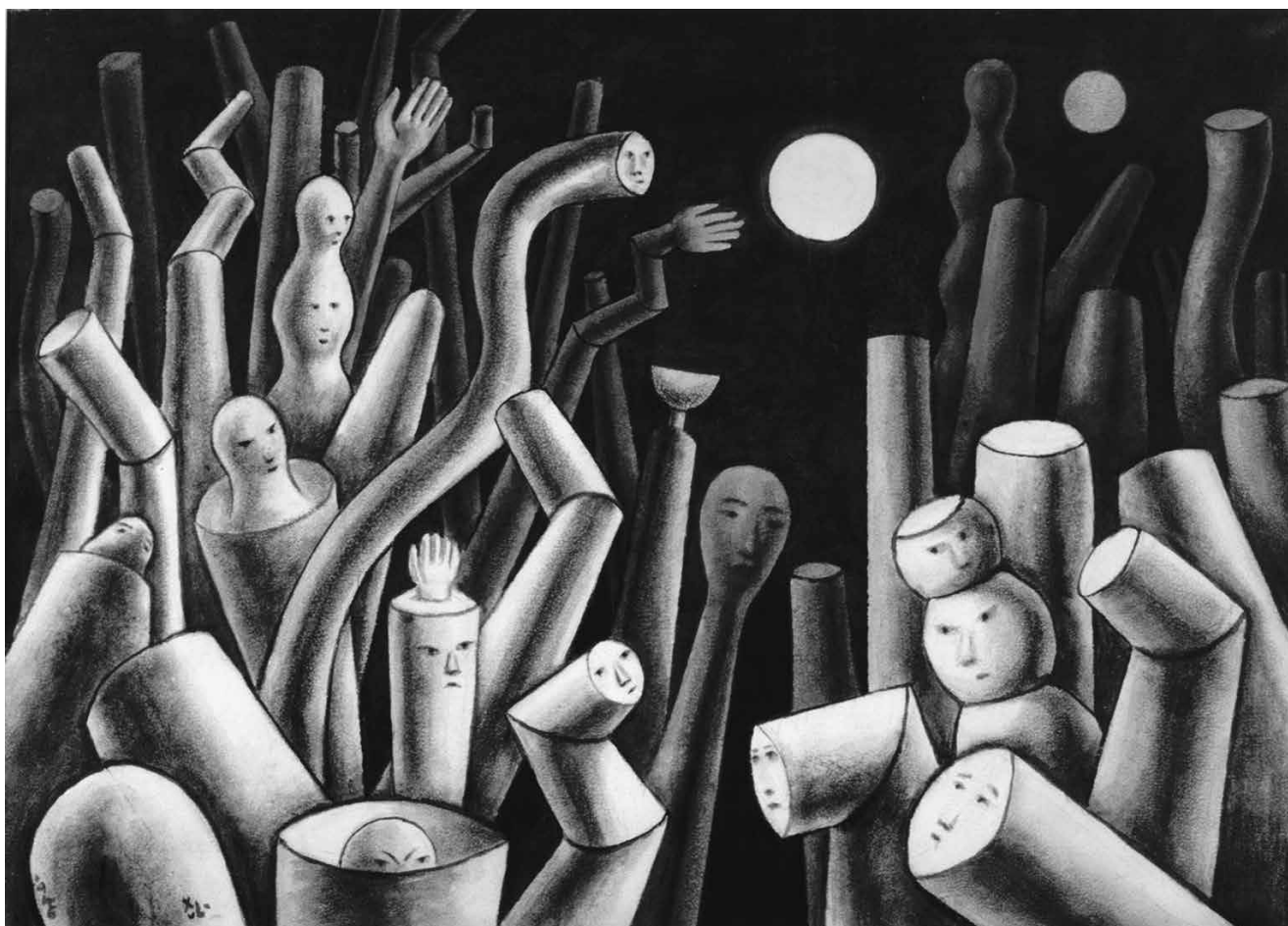
Casi plantas, témpera, 1946 | 35 x 50 cm

XUL SOLAR | DERECHOS RESERVADOS FUNDACIÓN PAN KLUB-MUSEO XUL SOLAR (ARGENTINA)