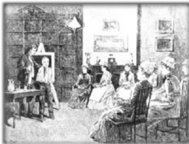
Una lección de vendaje. La sala de la casa de enfermeras del Bellevue Hospital en 1882. Grabado en madera. De Century Magazine, noviembre de 1882, en "Una nueva profesión para las mujeres".

La universidad se encuentra ante el desafío de hacerse presente en una sociedad veloz, caracterizada por la información sin fronteras, por la mundialización de las tensiones, por la acelerada acumulación de capital y por las crecientes diferencias y desigualdades