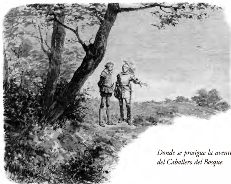
Donde se prosigue la aventura del Caballero del Bosque.

La masificación de los créditos educativos ha permitido a muchos de los jóvenes colombianos cuyas familias no