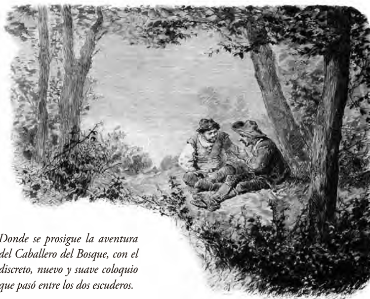
Donde se prosigue la aventura del Caballero del Bosque, con el discreto, nuevo y suave coloquio que pasó entre los dos escuderos.

en términos no necesariamente crecientes y acumulativos, sino cíclicos, discontinuos y singularizantes.