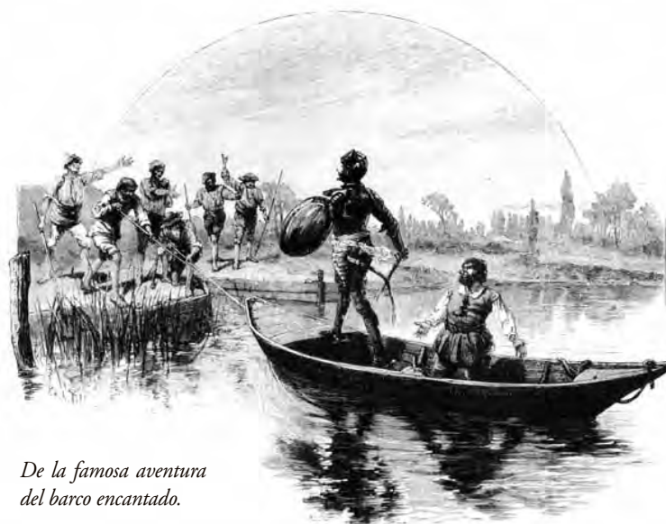
De la famosa aventura del barco encantado.

"Además, la pérdida del territorio de origen no sólo conlleva la desterritorialización sino también la pérdida de la identidad del sujeto desplazado, da origen a la asunción del anonimato, a la pérdida del nombre, de los vínculos de reconocimiento y afirmación social, a la