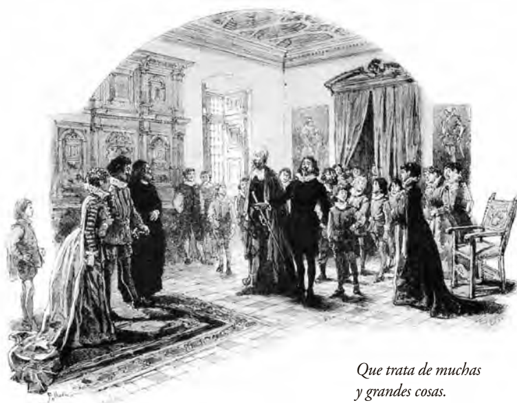
Que trata de muchas y grandes cosas.

así como la prestación de servicios medicinales y rituales. Básicamente lo que predomina aquí es la adopción de saberes culturales desarrollados por la otra etnia. Nutrirse de este legado que el otro comparte y a su vez compartir aquellos saberes en los que se tiene fortalezas y el otro grupo no las posee, con el fin de lograr la subsistencia de ambas etnias en el territorio del Pacífico colombiano rural.