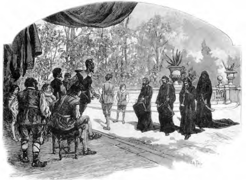
Donde se cuenta la extraña y jamás imaginada aventura de la Dueña Dolorida, alias la Condesa Trifaldi, con una carta que Sancho Panza escribió a su mujer, Teresa Panza.

Inicialmente predominan las de un piso, pero a partir del siglo XVIII hay bastantes de dos, a veces con entrepiso