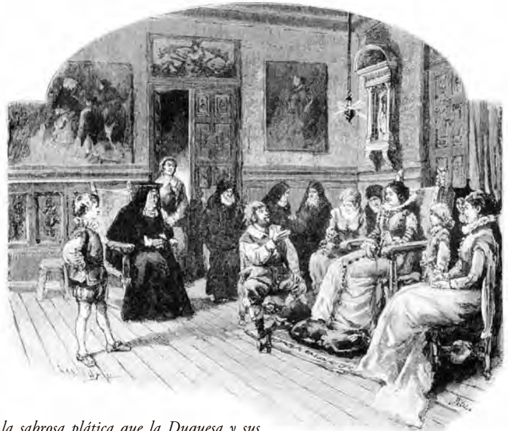
De la sabrosa plática que la Duquesa y sus doncellas pasaron con Sancho Panza, digna de que se lea y de que se note

Aquí la modernidad no siempre lo fue ni significó progreso, y buena parte de nuestra arquitectura actual es trivial y está influenciando mal el oficio y su enseñanza. Admiramos en fotos edificios sin su contexto pues ya no hacemos viajes de estudio, e ignoramos que son la crítica, el público y el tiempo lo que les da carácter de arte a algunos. Sin sentido de pertenencia y de lo pertinente, no