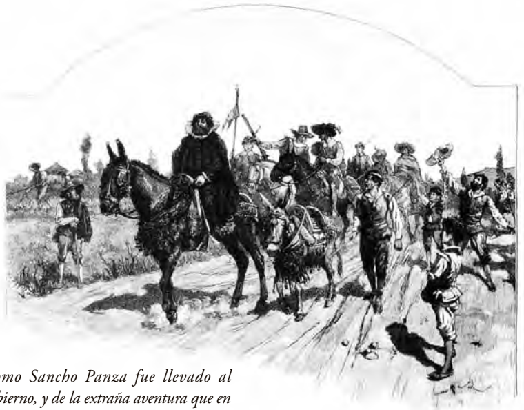
Como Sancho Panza fue llevado al gobierno, y de la extraña aventura que en el castillo sucedió á Don Quijote.

En arquitectura poco es nuevo pero los proyectos se vuelven complejos al desarrollarlos y cambian en la obra. Unas nuevas reglas son necesarias para identificar los ejemplos y seguirlos sin copiarlos (Norberg-Schultz, 1980). Deberían basarse en la teoría del arte y los conocimientos técnicos, mediante modelos, tipos, patrones y normas, en el marco de los hechos culturales, sociales, económicos, políticos, antropológicos, urbanos, arquitectónicos y constructivos de nuestras ciudades. Un canon evolutivo y confrontado por arquitectos, historiadores, teóricos y