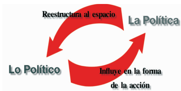
Figura N° 2. Construcción crítico epistemológica de la realidad

acción política, hay que mencionar que esta relación no debe ser pensada de forma lineal como un proceso en el que lo político da paso a la política . Así, la acción que no deviene de la reconstrucción de lo político en la realidad no puede hacer referencia a la política. La relación de lo político con la política no debe ser pensada como un proceso en el que el rescate de lo político dentro del fenómeno dé paso a la política. Lo político y la política se conciben como dos elementos en constante interacción, puesto que la política también tiene una influencia sobre lo político (Ver Figura 2).