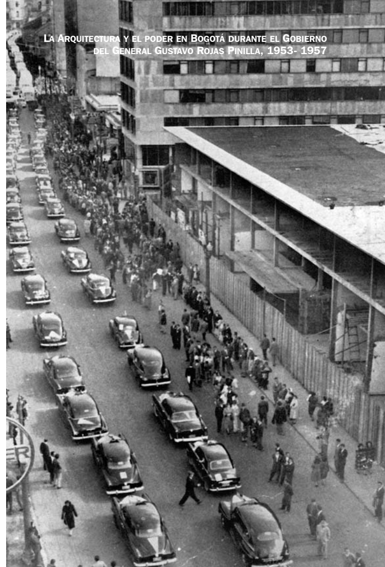
CORRIENTES INTERMINABLES DE AUTOMOTORES URGIDOS POR LA PRISA QUE CARACTERIZA NUESTRA ÉPOCA. RUEDAN INCESANTEMENTE SOBRE VÍAS QUE SOPORTAN EL TRAFAGO DE MILES Y MILES DE TRANSEÚNTES. HE AQUÍ UNA ORDENADA MANIFESTACIÓN LLEVADA A EFECTO POR AUTOMÓVILES DE SERVICIO PÚBLICO EN BOGOTÁ.

Cabe recordar que en este período se presentó en Bogotá, al igual que en las principales ciudades del país, una crisis social debido a los diferentes fenómenos de migración causados por la violencia política y el interés por la modernización y el progreso. El país que recibió el general, estaba lastimado por las luchas bipartidistas y por las ansias de poder de los diferentes partidos. Es una etapa de despegue económico que se reflejó en el mejoramiento de los sistemas de comunicaciones, infraestructura urbana, obras arquitectónicas sociales y culturales, más importantes del siglo XX, además del desarrollo de tecnologías, el cambio en el pensamiento político y continuidad en los modelos económicos dejados por los gobiernos anteriores.