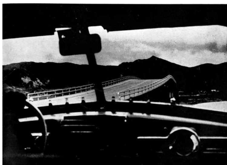
MODERNA OBRA DE INGENIERÍA VIAL CONSTRUIDA POR EL ACTUAL GOBIERNO Y DESTINADA A DAR UN CÓMODO ACCESO A LA CIUDAD CAPITAL POR SU EXTREMO NORTE