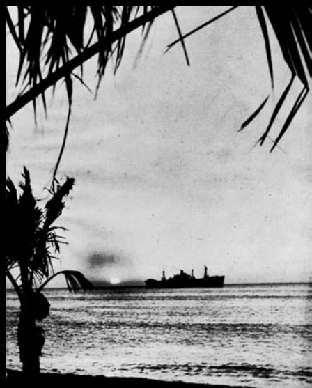
UN SOL QUE AGONIZA, UN BARCO QUE REPOSA Y UNAS PALMERAS QUE SE MECEN A IMPULSO DE LA BRISA MARINA, DAN A ESTE PAISAJE TROPICAL UNA MAJESTUOSA BELLEZA. RETAZOS DE NUESTRAS BAHÍAS Y ENSENADAS DARÍAN INSPIRACIÓN A LOS MÁS AFAMADOS PINCELES

ARCHIVO GENERAL DE LA NACIÓN. Bogotá. IDCT. ALCALDÍA MAYOR DE BOGOTA. Bogotá ayer y hoy. MUSEO DE DESARROLLO URBANO. Bogotá CD. 1998. Ministerio de Transporte. INVIAS. CAN. Bogotá.