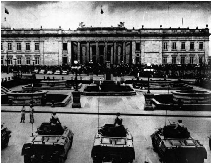
ES EN LA PLAZA PRINCIPAL DE BOGOTÁ DONDE SE HAN CUMPLIDO INDELEBLES EPISODIOS PARA LA REPUBLICA, PRESIDENTES Y LEGISLADORES, MAGISTRADOS Y PATRICIOS HAN PRESENCIADO, DESDE LAS GRADAS DEL CAPITOLIO NACIONAL, EL OLEAJE DE MULTITUDES Y EL FLAMEAR DE LAS BANDERAS. ALLÍ REPERCUTE EL ECO DE LA PATRIA