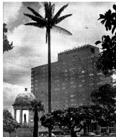
BOGOTÁ COSMOPOLITA. ARROGANTE Y MODERNO, EL "HOTEL TEQUENDAMA" EMPINA SOBRE LA CIUDAD SU IMPONENTE MOLE, LOS INNÚMEROS VENTANALES SE ABREN COMO PUPILAS PARA CONTEMPLAR LA SILUETA DEL PADRE DE LA PATRIA, MÁS ALTO EN EL CORAZÓN DE SUS HIJOS QUE TODAS LAS OBRAS CREADAS POR MANOS HUMANAS

Los barrios construidos por el Estado fueron diseñados de acuerdo a modelos específicamente propuestos a nivel internacional como paradigmas de acción, por ejemplo los planteamientos de los CIAM y también se desarrollaron modelos internos de trabajo.