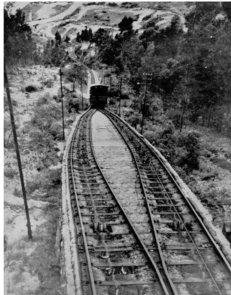
SOBRE EL LOMO DE “MONSERRATE”, ALTA EMINENCIA QUE DOMINA A LA CIUDAD CAPITAL, CABALGA, CON PASO LENTO PERO SEGURO, EL FUNICULAR, OBRA DE INGENIERÍA QUE ALCANZA DESNIVELES HASTA DE 80.5% Y QUE PERFORA EN UN LARGO TRAYECTO LAS ENTRAÑAS DEL CERRO, HASTA DOMINAR LA CUMBRE