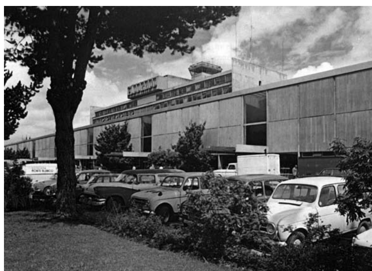
RESIDENCIAS, HOSPITALES, FÁBRICAS Y EDIFICIOS PÚBLICOS, POR TODAS PARTES Y PARA TODA CLASE DE ACTIVIDADES VEMOS LEVANTARSE, ESTRUCTURAS EN ESTILO DE COLMENAS IMPUESTAS POR LA CIVILIZACIÓN DEL SIGLO XX. COMPRENDIÉNDOLO ASÍ, COLOMBIA TRABAJA AFANOSAMENTE EN LAS OBRAS DESTINADAS AL BIEN PÚBLICO