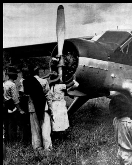
LAS AVES MECÁNICAS, EN VACACIONES DE PASEOS TURÍSTICOS Y COMERCIALES PLEGARON SUS ALAS Y ABRIERON SUS ENTRAÑAS PARA RECIBIR Y DEVOLVER SU HEREDAD A QUIENES UN DÍA HUBIERON DE TOCAR LA MAJESTAD DE SUS HORIZONTES POR EL SÓRDIDO Y RECORTADO ESPACIO DE LOS SUBURBIOS QUE ASFIXIAN Y ENVILECEN