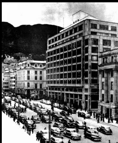
LA ESPAÑOLISIMA Y COLONIAL, SANTA FE DE BOGOTÁ, RECOGIDA BAJO LA EMINENCIA DE SUS CAMPANARIOS, SUMIDA EN LA PENUMBRA DE SUS ANGOSTAS Y RETORCIDAS CALLEJUELAS, CAMBIA SU ROSTRO Y MUDA SUS COSTUMBRES. ARTERIAS COMO LA “AVENIDA JIMÉNEZ DE QUESADA” IMPRIMEN NUEVO AMBIENTE A LA CIUDAD DE ANTAÑO

PÁEZ DEL RÍO, Luís Eduardo. Bogotá. Estructura y principales servicios públicos. Bogotá: Cámara de Comercio de Bogotá, 1978.