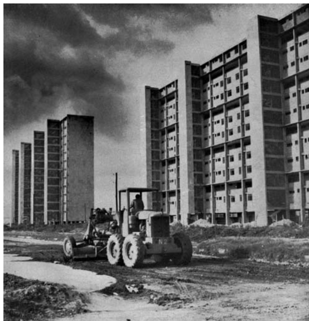
AL PAR QUE LOS EDIFICIOS YERGUEN SUS SILUETAS, LAS CILINDRADORAS Y PAVIMENTADORAS FORMAN LAS CALZADAS, CALLES, CARRERAS Y AVENIDAS QUE CAMBIARAN EN BREVE EL PAISAJE ALETARGADO Y SOMNOLENTO, DE UN VERDE ATRISTADO POR EL CUADRO DE AJEDREZ BULLENTE Y ACTIVO, ILUMINADO Y CAMBIANTE.