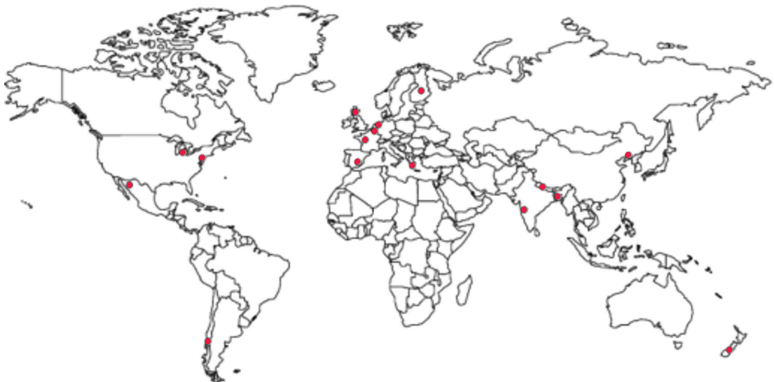
FIGURA 2 UBICACIÓN DE LOS ESTUDIOS DE VALORACIÓN