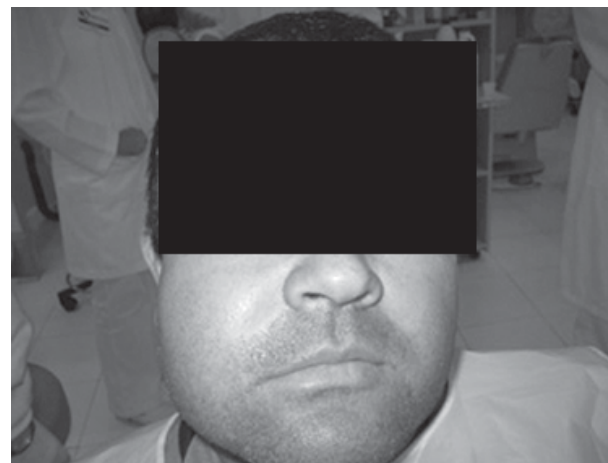
Figura 1 – Aspecto clínico do paciente 30 minutos após o término da consulta

ao preparo biomecânico. Após o término da instrumentação e a colocação de hidróxido de cálcio como medicação intracanal, o paciente foi dispensado, e agendou-se uma posterior obturação dos canais. Passados 30 minutos da consulta odontológica, o paciente retornou ao consultório com grande edema na face, bem como com edema e hematoma na mucosa e no palato e alguns pontos de necrose na região de fundo de sulco do dente em tratamento (figuras 1 e 2). Depois de exame clínico e diagnóstico, sugeriu-se ao paciente que permanecesse em repouso até a diminuição do inchaço. O monitoramento da situação clínica do paciente foi feito nos primeiros dois dias, a fim de observar a regressão do edema. Não foi receitada medicação sistêmica.