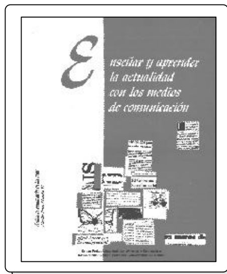
Enseñar y aprender la actualidad con los medios de comunicación. Varios autores Grupo Pedagógico «Prensa y Educación» Huelva, 1994; 177 páginas

El análisis de la actualidad en las aulas para el conocimiento y la comprensión del mundo encuentra, sin duda, en los medios de comunicación unos insustituibles aliados. Sin embargo, en la escuela de hoy, actualidad y medios siguen siendo retos pendientes y «cenicientas». En este contexto de reivindicación y reflexión ha de entenderse este documento que recoge propuestas, experiencias e investigaciones llevadas a cabo por profesores, investigadores y periodistas expertos en el uso didáctico de los medios de comunicación y las nuevas tecnologías audiovisuales de la información en los centros educativos.