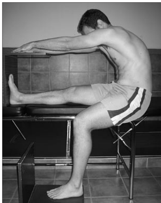
Figura 1. Posición de máximo alcance en el test sit-and-reach unilateral.