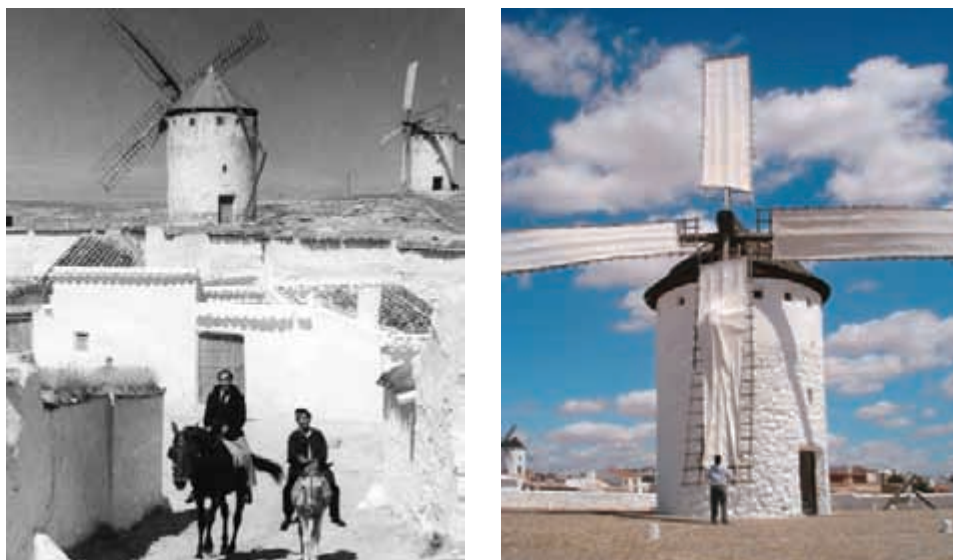
Figura 3. Barrio del Albaicín y molinos históricos. Situación en los años 60 (izquierda). Molino sardinero en el cerro de la paz. 2005 (derecha)

Fuente: Archivo General de la Administración y autores.