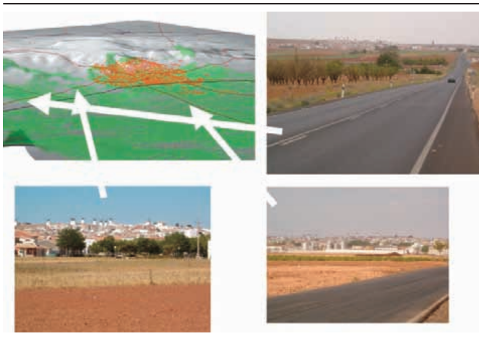
Figura 2. La configuración visual del paisaje y las carreteras de acceso

Convención de Florencia—. A partir de tales percepciones, el paisaje material está en la base de imágenes culturales y de representaciones estéticas que son indisociables de las formas y de los filtros interpretativos propios de cada época y de cada cultura.