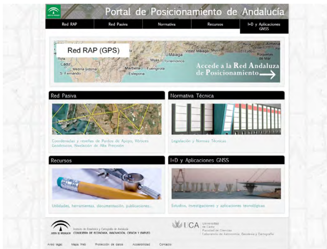
Imagen 1. Portal de acceso a la Red Andaluza de Posicionamiento.