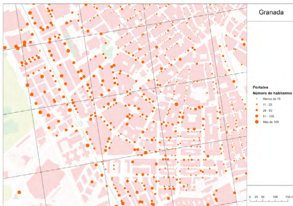
Mapa 5. Salida gráfica de la aplicación Distribución Espacial de la Población en Andalucía.