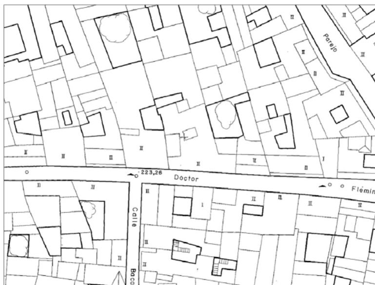
Mapa 1. Fragmento de cartografía urbana.