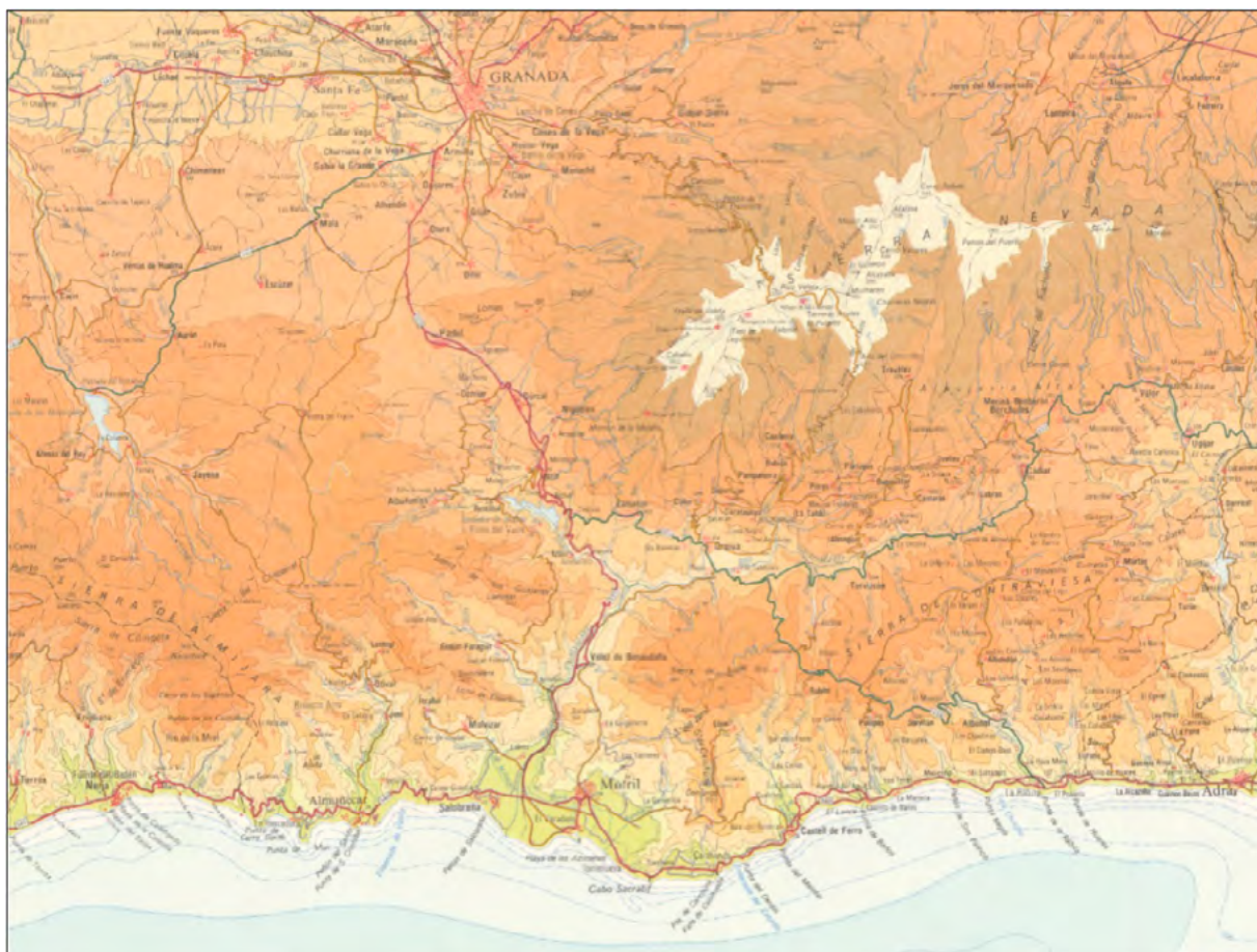
Mapa 2. Fragmento del Mapa de Andalucía 1:300.000.