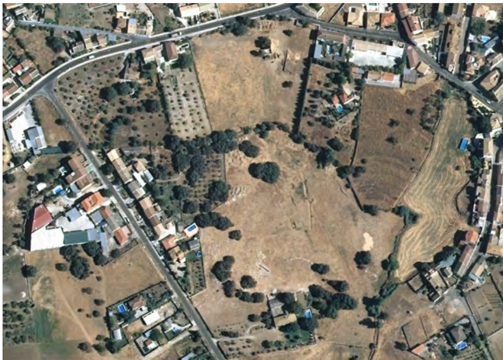
Mapa 4. Ortofotografía Digital de Andalucía, 2010-2011.