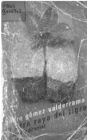
Imagen 3. Portada: La otra raya del tigre (1986).

gencia tipográfica marcada a lo largo de toda la edición: el uso de comillas francesas o angulares. Además, todo el epígrafe se encuentra en itálicas, lo que denota una variante tipográfica visible en relación con las dos ediciones anteriores.