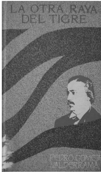
Imagen 2. Portada: La otra raya del tigre (1978).