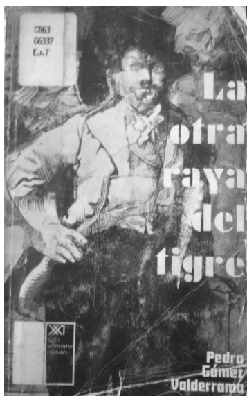
Imagen 1. Portada: La otra raya del tigre (1977).

La primera edición de esta novela se publica el 15 de abril de 1977 y mide 21 x 13,5 cm. Publicada por Siglo Veintiuno Editores con un tiraje de tres mil ejemplares e impresa en los talleres gráficos de la Editorial Guadalupe Ltda., rápidamente es reimpressa en una segunda edición en octubre del mismo año, por la misma editorial e impresa en los talleres gráficos de Italgraf S. A. La portada es de papel cartón y consta de una ilustración hecha por el ganador del Premio Mejor Grabador Latinoamericano en la Bienal de Sao Pablo, el pintor colombiano-español Juan Antonio Roda, en ella encontramos en la esquina inferior izquierda el logo de la editorial; en la esquina inferior derecha el nombre del autor; y con alineación derecha, leemos el nombre de la obra distribuido en cinco renglones (ver Imagen 1).