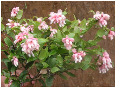
Gaultheria erecta Vent. Ericaceae.

Todos los protocolos definidos en la presente propuesta pueden ser aplicados en cualquier vivero, finca o casa campesina, debido a que los materiales e insumos utilizados son de uso diario, lo que permite la fácil propagación por los técnicos, viveristas y la comunidad en general.