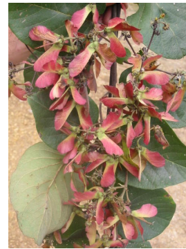
Stygmaphyllon sp. Malpighiaceae.