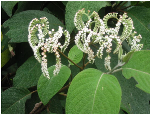
Tournefortia fuliginosa Kunth. Boraginaceae