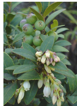
Vaccinium corymbodendron Dunal. Ericaceae.