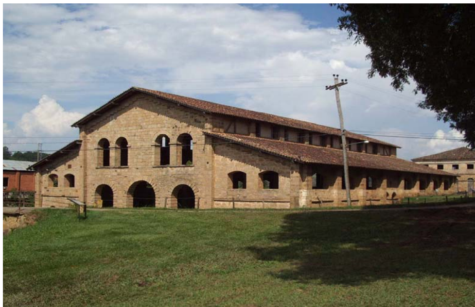
Figura 1: Fábrica de armas blancas – Iperó (Brasil)

Real Fábrica de Hierro de Ipanema: Considerada la primer siderúrgica de Brasil, fue inaugurada en 1818 (Figura 1). Se ubica en el municipio de Iperó, en la Floresta Nacional de Ipanema (FLONA de Ipanema) una unidad de conservación creada en 1992, con un área de 5 mil ha. La fábrica contaba con 8 hornos de 1,5 metros de altura que producían el hierro utilizado en la fabricación de arados, clavos, instrumentos agrícolas, guadañas e, inclusive, armas blancas (espadas, sables y bayonetas). Debido a la llegada de empresas industriales extranjeras cerró en 1895.