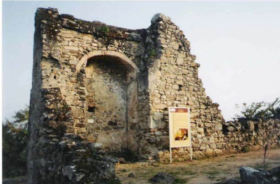
Figura 2: Paredes remanentes de la antigua iglesia en Peruibe (Brasil)

función misionera y a los indígenas les daba la impresión de que podía estar en diversos lugares al mismo tiempo.