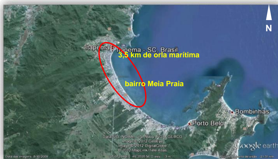
Figura 2: Vista aérea del Barrio Meia Praia, Itapema, Santa Catarina