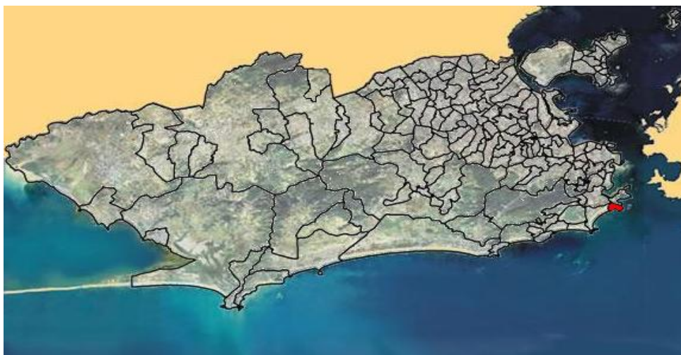
Figura 1: Identificación de la localización del barrio de Leme en el municipio de Rio de Janeiro