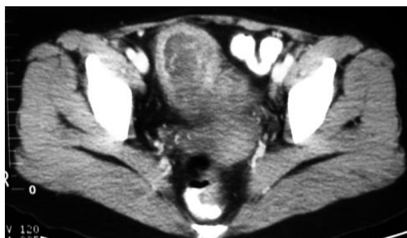
FIGURA 1. TAC abdominal. Tumor vesical infiltrante. Gran masa endoluminal con engrosamiento de la pared vesical, afectando la capa muscular y grasa perivesical.

bimanual positivo. El estudio anatómico-patológico de la RTU-biopsia se informa de tumor maligno vesical de probable etiología muscular. La tomografía axial computerizada (TAC) sugería un tumor vesical infiltrante (Figura 1). El rastreo óseo, y la radiografía y tomografía torácica no presentaban enfermedad a distancia.