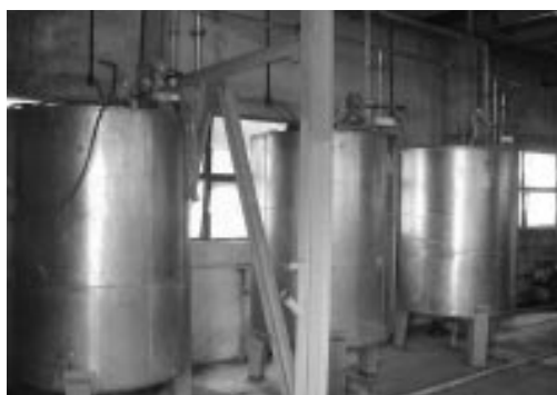
Tanques para homogenización, ajuste de pH y bombeo a tratamiento