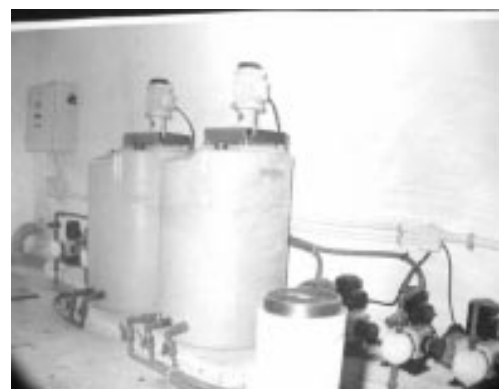
Características exteriores e interiores de una parte de la planta de tratamiento de en la Empresa de Sueros y Hemoderivados.