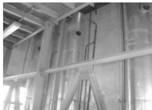
Fig. 3. Tratamientos de desinfección. Torres de ozonización.

acumulados en los filtros anaerobios. Con la tarea técnica se desarrollaron los proyectos y con la construcción de la planta de tratamiento se permitió el funcionamiento de la planta piloto.