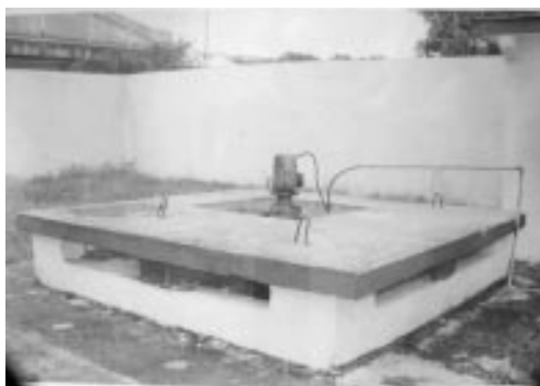
Tanque para segregar corriente, homogenización y ajuste de pH.

Investigaciones Científicas que se tratan en una laguna de oxidación. Las aguas residuales de esta planta piloto presentaron concentraciones de materia orgánica elevadas y variables. El tratamiento consta de un tanque de recepción de todas las corrientes, bombeo hacia una unidad de tanques para la homogenización (Fig. 4, vistas superiores) y ajuste de pH a 7 \pm 0,5 unidades, bombeo hacia los filtros anaerobios (Fig. 2). Los tanques para descarga del efluente y su posterior recirculación, en caso de ser necesario o bombeo hacia las torres para la ozonización (Fig. 3), como tratamiento final, para la reducción de posibles contaminantes que aún permanezcan o para su desinfección. El tratamiento mediante los filtros anaerobios puede ser en paralelo o en serie, en dependencia del caudal y de la carga orgánica de las aguas residuales. El sistema está provisto de una campana para la acumulación del biogás generado, así como de válvulas para la descarga de los lodos