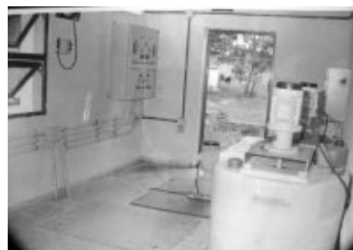
Ajuste de pH y estación de bombeo.