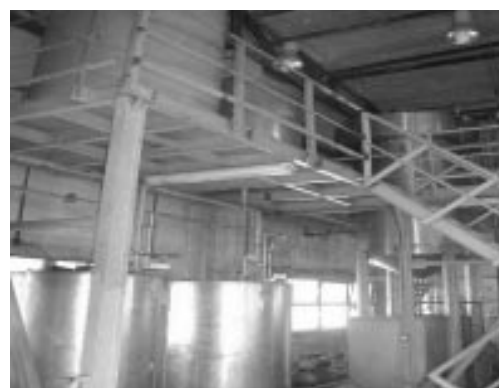
Características exteriores e interiores de la planta de tratamiento del Centro Nacional de Investigaciones Científicas.