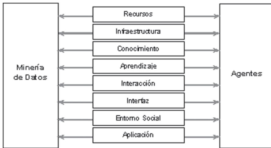
Fig. 1. Elementos de integración e interacción de Agentes y Minería de Datos. Fuente: Adaptado de Cao (2009)

de Minería de Datos basada en estrategia Multiagente, que sirve de apoyo al personal médico para el diagnóstico de casos clínicos de forma objetiva, los cuales son inferidos a través de un árbol de decisión que analiza reglas de clasificación adquiridas de historias clínicas y fuentes distribuidas de datos médicos.