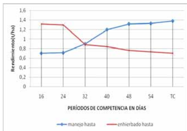
Figura 2. Rendimiento del grano del frijol ( t \cdot ha^{-1} ) en diferentes periodos con arvenses y sin arvenses

Rendimiento ( t \cdot ha^{-1} ). En concordancia con los resultados de la Figura 2 al mantenerse el área cultivada sin arvenses durante todo el ciclo se evitaron en su totalidad las acciones de competencia obteniéndose un rendimiento de 1,38 t \cdot ha^{-1} que numéricamente equivalen a un 100 % de la producción.