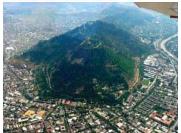
Comuna de Recoleta: Parque Metropolitano (>60% Arbolado)

Con todo, los titulares de los proyectos, que no deseen someterse al Plan Verde, podrán ejecutar la construcción de áreas verdes en forma separada.