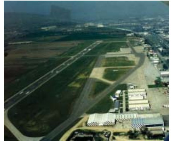
Comuna de Cerrillos: Aeródromo (Pastos y Malezas)

d) Proyectos de colaboración público-privado. Por ejemplo Acuerdos de Producción Limpia-áridos, entre otros.