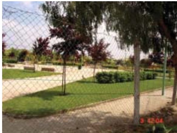
Comuna de El Bosque: Plaza implementada (10 a 25% arbolado)

Al financiar estos proyectos, las empresas podrán, por ejemplo, acreditar el cumplimiento de compensaciones que se les exija a partir de cualquiera de los instrumentos existentes en nuestro ordenamiento jurídico, especialmente aquellos provocados por las emisiones de acuerdo a las disposiciones del Plan de Prevención y Descontaminación para la Región Metropolitana (PPDA), y exigidos en el marco del Sistema de Evaluación de Impacto Ambiental.