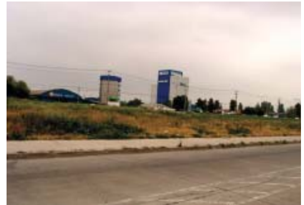
Comuna de Conchalí: Bandejón (Pastos y Malezas)

Actualmente la construcción y mantención de las áreas verdes se encuentra radicada en los Municipios, el Ministerio de Vivienda y Urbanismo y los Gobiernos Regionales. Este último principalmente a través de los recursos que aporta por el Fondo Nacional de Desarrollo Regional (FNDR).