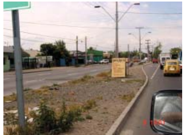
Comuna de La Cisterna: Bandejón sin implementación (Eriazo)