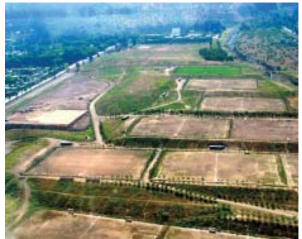
Comuna de La Reina: Parque (Pastos y Malezas)

En este sentido, como se indicó previamente, el titular de un proyecto que deba compensar a través de la construcción y mantención de áreas verdes, podrá financiar algunas de las carpetas de proyectos disponible por parte de la Corporación Verde y de esta forma dar cumplimiento a las exigencias establecidas en la Resolución de Calificación Ambiental. Cabe señalar que el hecho de financiar estos proyectos, no se exime del cumplimiento de la RCA, sino que se libera de la carga de ejecutarlo en forma directa, con todas las dificultades que ello conlleva.