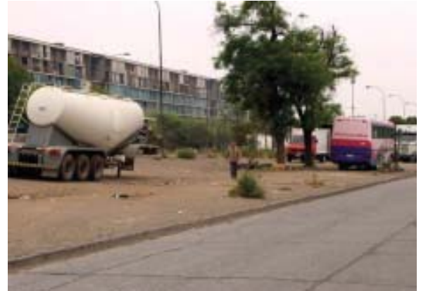
Comuna de Santiago: Bandejón sin implementación (<10% arbolado)

plementación y mantención de áreas verdes; cumplir con la meta territorial de lograr el equilibrio urbano de áreas verdes en la ciudad de Santiago (6 m 2 por habitante en un radio de 20 minutos de accesibilidad, o al menos informar de instancias paralelas que pueda existir en la materia); Con el objeto de asegurar una adecuada participación Corporación