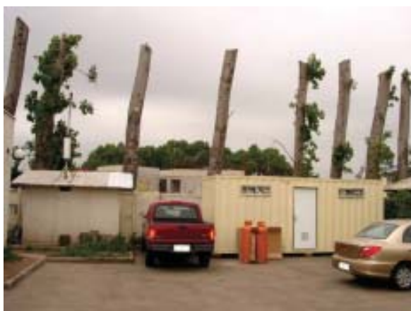
Comuna de Quilicura: Área Verde Desafectada

Como objetivo general se encuentra mejorar Calidad Ambiental de la Ciudad de Santiago, aumentando la dotación de espacios verdes, a través de co-ordinar un plan estratégico de áreas verdes