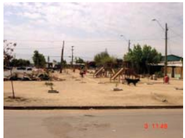
Comuna de El Bosque (*): Plaza Nueva (eriazó)