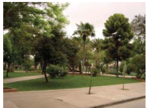
Comuna de Quilicura: Área verde con alta cobertura (>60% arbolado)