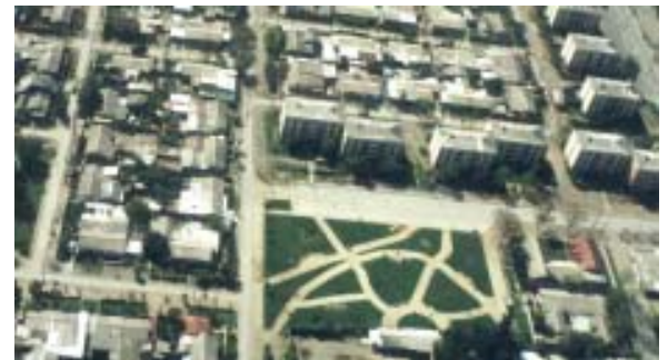
Comuna de Pudahuel: Plaza "implementada" (pastos y malezas)