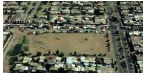
Comuna de Pudahuel: Sitio eriazo

En una primera etapa, se utilizará la Corporación de Amigos del Parque Metropolitano, en la que participará representante del Intendente, del MINVU y de la Cámara Chilena de la Construcción. Esta entidad se estima que cumplirá de forma adecuada, ya que se ha dedicado a buscar recursos y construir