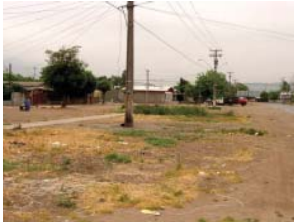
Comuna de Conchalí: Área Verde No Implementada

a posiblemente través de la Ley de Emisiones Transables actualmente en discusión parlamentaria.