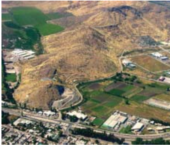
Comuna de Renca: Parque (<10% Arbolado) Quilicura: Cerro (Pastos y Malezas)