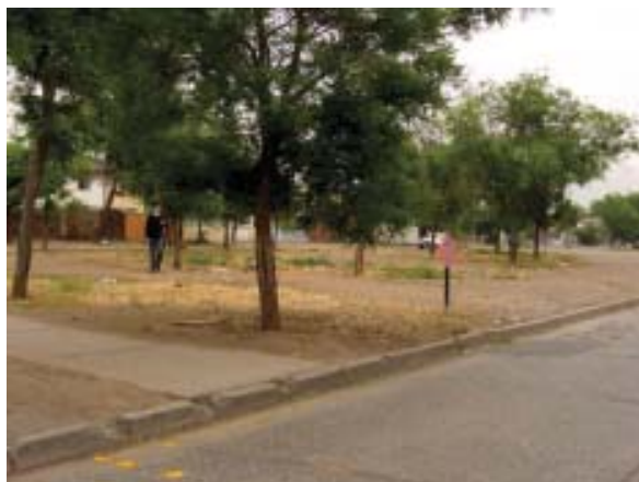
Comuna de Renca: Bandejón <10% de Arbolado