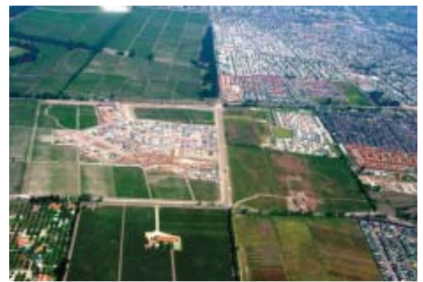
Comuna de Macul: Área verde desafectada (cultivo agrícola y <10% arbolado)