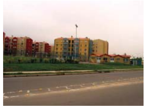
Comuna de Conchalí: Área Verde Desafectada

El Plan Verde es un instrumento de gestión y fomento destinado a incrementar la construcción y mantención de las áreas verdes a nivel nacional y regional, sobre la base del apoyo y la acción coordinada del sector público y privado, mediante la utili-