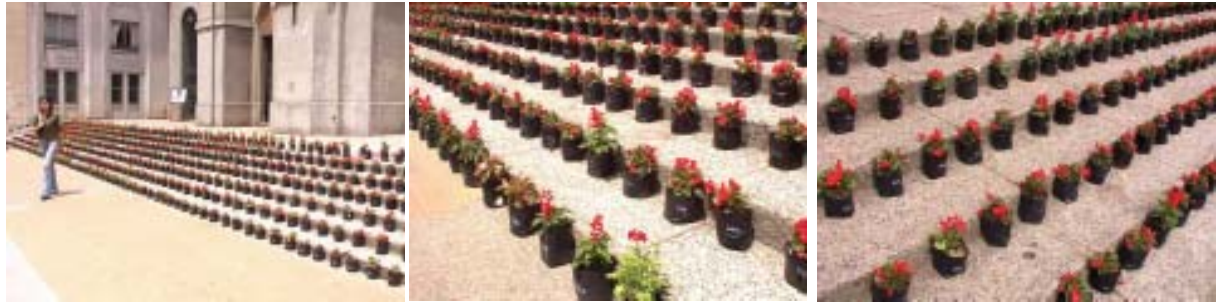
Montaje de 1.200 plantas en atrio de la catedral de Concepción (porcelanas y fresias).

retardar el tranco de la gente. Pero supongo que si nadie pisó el pasto es porque lo vieron.