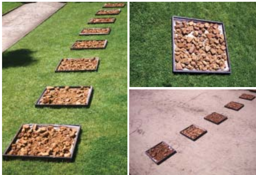
Montaje de bandejas con material pétreo en área del parque Ecuador.

De ahí en adelante, el pasto comenzó a crecer, a cultivarse, en el interior de la propiedad privada de cada colaborador. Paradójicamente, el suelo que ocuparía un espacio público de la ciudad estaba siendo preparado en un ámbito íntimo y particular, un lugar doméstico, con toda la connotación emotiva y protectora que se desprende de ese acto de cuidar.