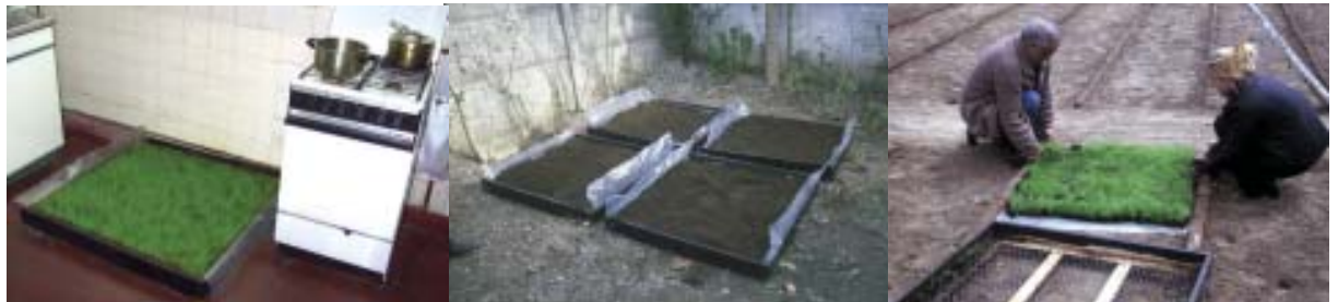
Ejemplos domésticos de incorporación natural de áreas verdes al hábitat humano.

El proyecto AV establece un continuo proceso de integración entre la obra plástica y la obra práctica. Si bien las instalaciones fueron concebidas como trazados esquemáticos y autónomos, como presentaciones transitorias de materia natural, el destino definitivo de la operación sería la construcción responsable del paisaje específico de una comunidad. Tal vez, con