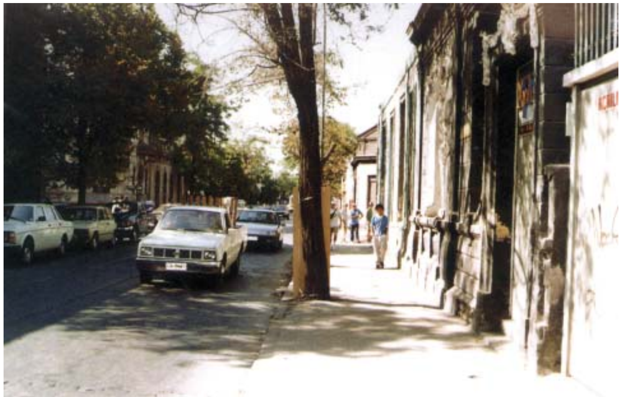
Apacible barrio de casco antiguo de Santiago y que ha experimentado despoblamiento residencial.

En términos de la administración de recursos financieros es posible señalar que el Municipio de Santiago, es el más poderoso y autónomo de la ciudad y del país, dada la estabilidad en el crecimiento de sus recursos propios permanentes. Actualmente el