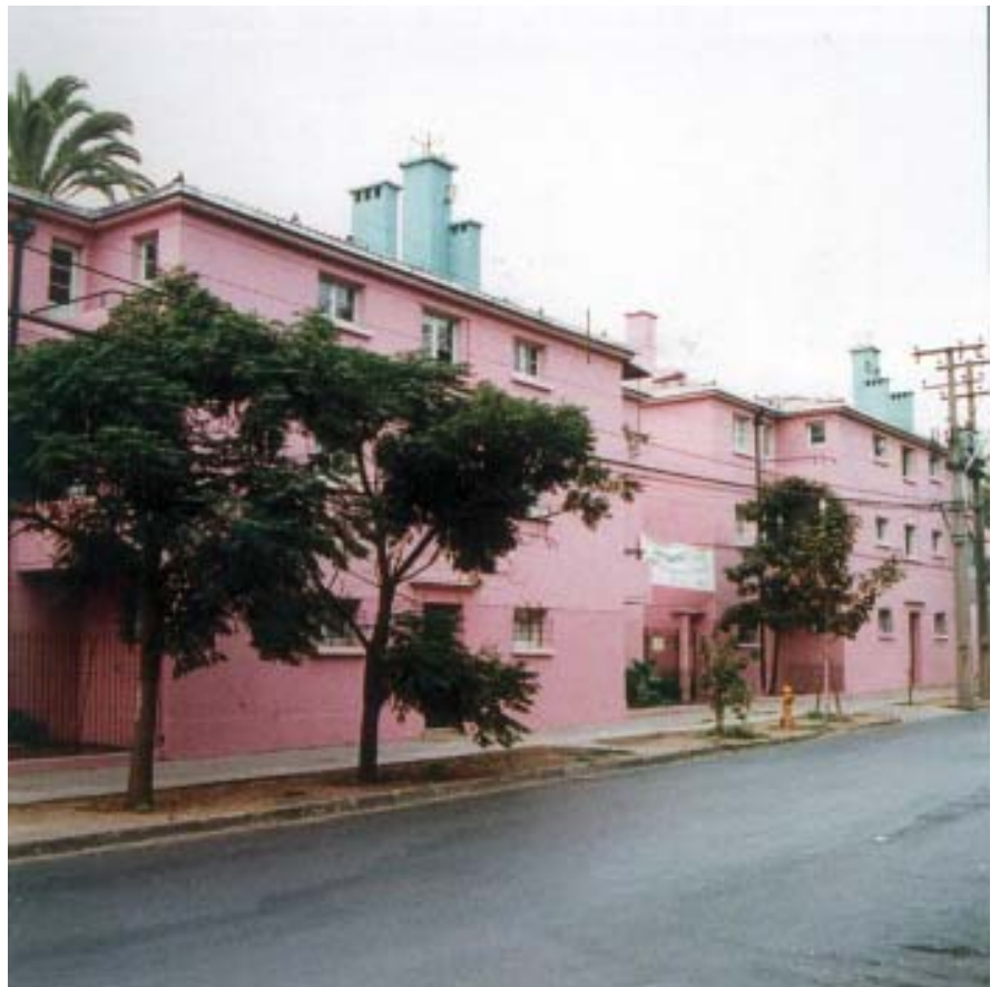
Revitalización de barrios residenciales como parte del programa de repoblamiento urbano. Barrio Huemul, Santiago sur.

En esta fase la Bolsa de Demanda consolida la inscripción de 1.500 grupos familiares «maduros», es decir con las condiciones de ahorro necesarias para optar a proyectos habitacionales en oferta, y