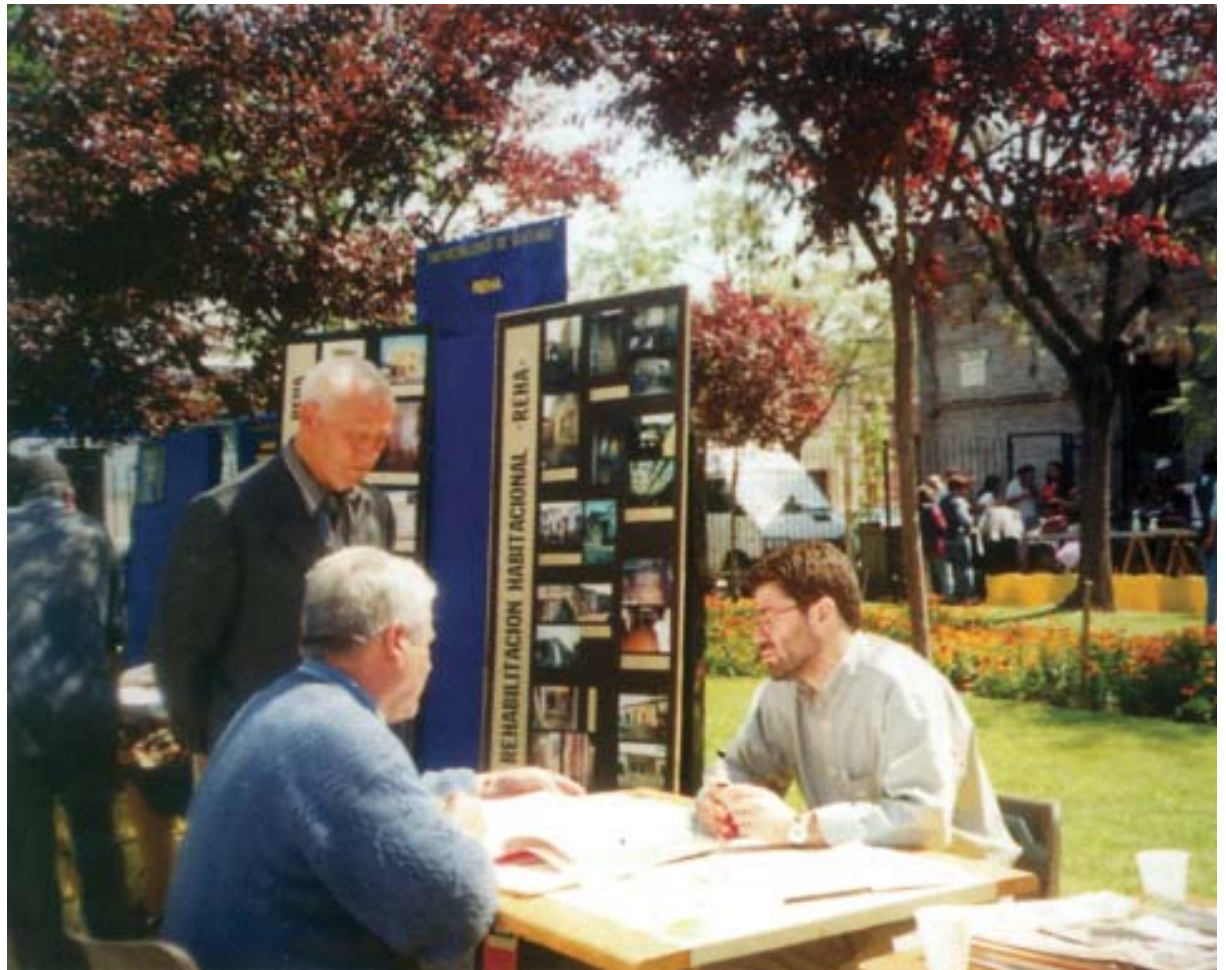
Programa de rehabilitación urbana que fomenta el mejoramiento de viviendas antiguas de barrios de la comuna de Santiago.

De esta forma se consolidaron tres frentes de gestión, respecto de los cuales las estrategias fueron las siguientes: