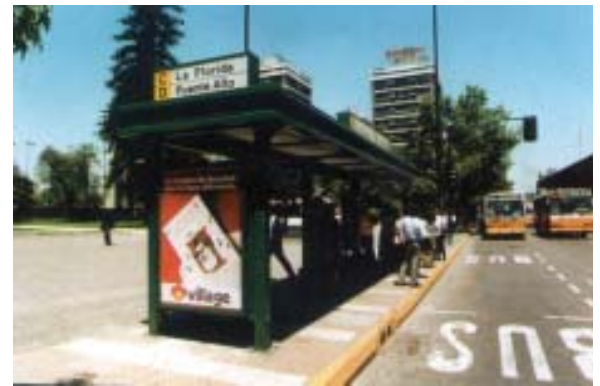
Transporte hacia nuevas comunas, las que han crecido con el despoblamiento residencial del casco antiguo de Santiago.

Estableciendo una nueva forma de relación con la sociedad civil, a comienzos de los 90, el Municipio desarrolló un programa de participación de la comunidad residente y usuaria de la comuna, a objeto de