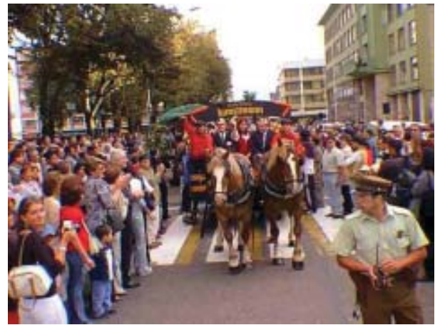
Fiesta de la Cerveza:

Finalmente es posible afrontar el crecimiento urbano con desarrollo endógeno y exógeno equilibrado dentro de una planificación por metas que esta dispuesta a cumplir.