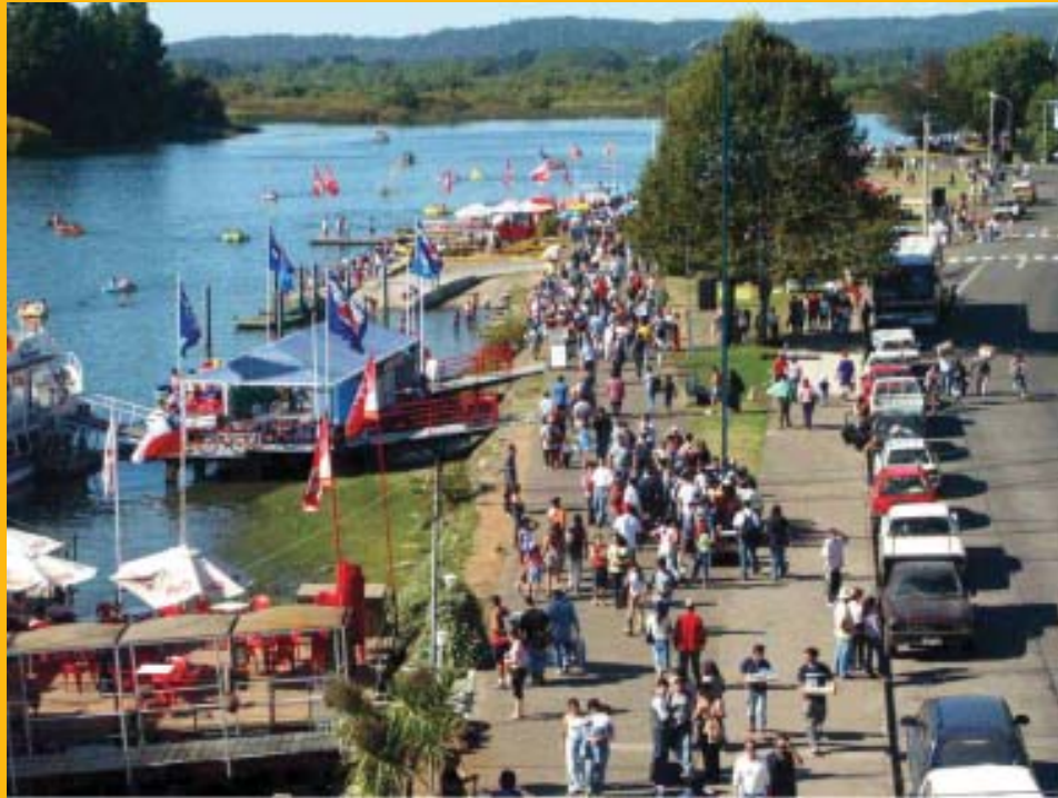
Semana valdiviana: arriba, durante el día; en la noche desfile de barcos (abajo)