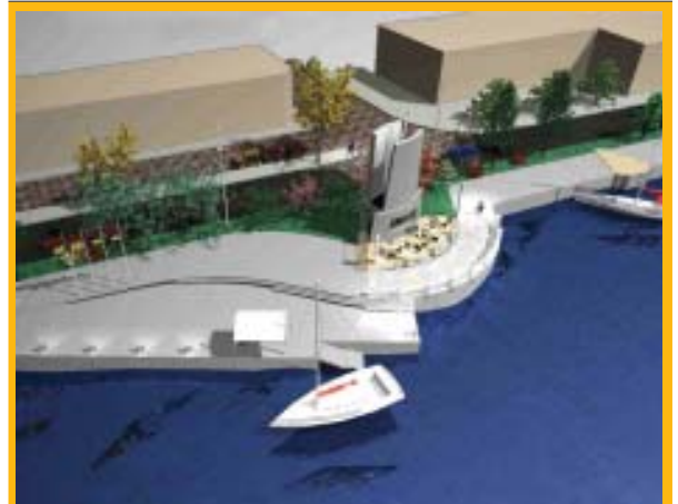
Proyecto: Mirador el Faro, costanera Arturo Prat frente Terminal de Buses.