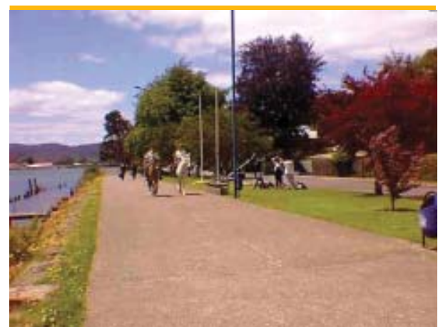
Paseo costanera Arturo Prat, borde Río Valdivia, entre los puentes Valdivia y Calle - Calle. Se estima que 25.000 turistas recorren este lugar de encuentro y de belleza