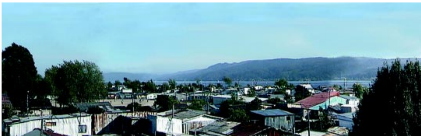
Vista hacia el cauce del río Bío Bío, arriba.

Mercociudades es la principal red de municipios del Mercosur y fue fundada a partir de la iniciativa de los principales alcaldes de la región, con el propósito "de favorecer la participación de las entidades edilicias en el proceso de integración regional, promoviendo la creación de un ámbito institucional para las ciudades del bloque sudamericano y desarrollar el intercambio y la cooperación horizontal entre las municipalidades de la región". En estas Mercociudades, participan un total de 138 comunas de países del cono sur, tanto de Argentina, Brasil, Paraguay, Uruguay, Chile y Bolivia y entre las que Concepción tiene una gran presencia y referencia de