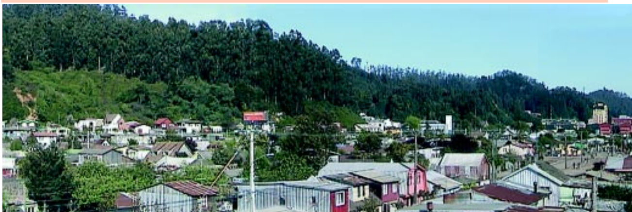
Pedro de Valdivia Bajo, caso emblemático en la ciudad de Concepción, del "Programa 200 Barrios". Vista hacia el cordón de cerros costeros, arriba.