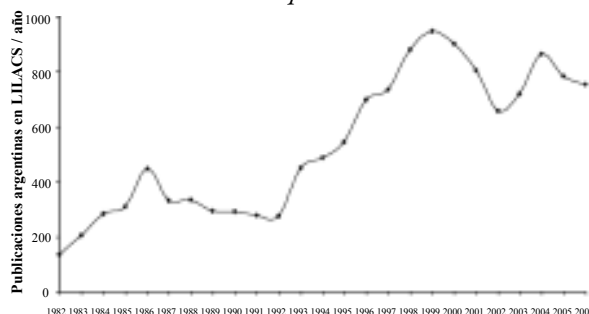
Figura 2. Publicaciones argentinas en la base de datos LILACS durante el período 1982-2006.

de descenso o meseta en la producción científica argentina. El primer período con esta característica fue entre 1987-1992 y se caracteriza por coincidir con el período vertiginoso en la economía argentina recordado por todos por la hiperinflación de esa época. El segundo período se desarrolló entre los años 2000-2002 y se correlacionó por la crisis gubernamental asociada a la recesión económica y el "corralito financiero". Fuera de estos períodos impresiona haber en la Argentina una gran capacidad de producción científica, la cual parecería ser afectada por las circunstancias económicas y sociales del país. Continuando la evaluación de la producción científica argentina reflejada en la literatura científica internacional, utilizamos la base de datos de la RICYT ( http://www.ricyt.org/ ) en el período 2005 (Tabla 1). Comparando los datos de países de Iberoamérica y utilizando los datos de SCI, se estima-