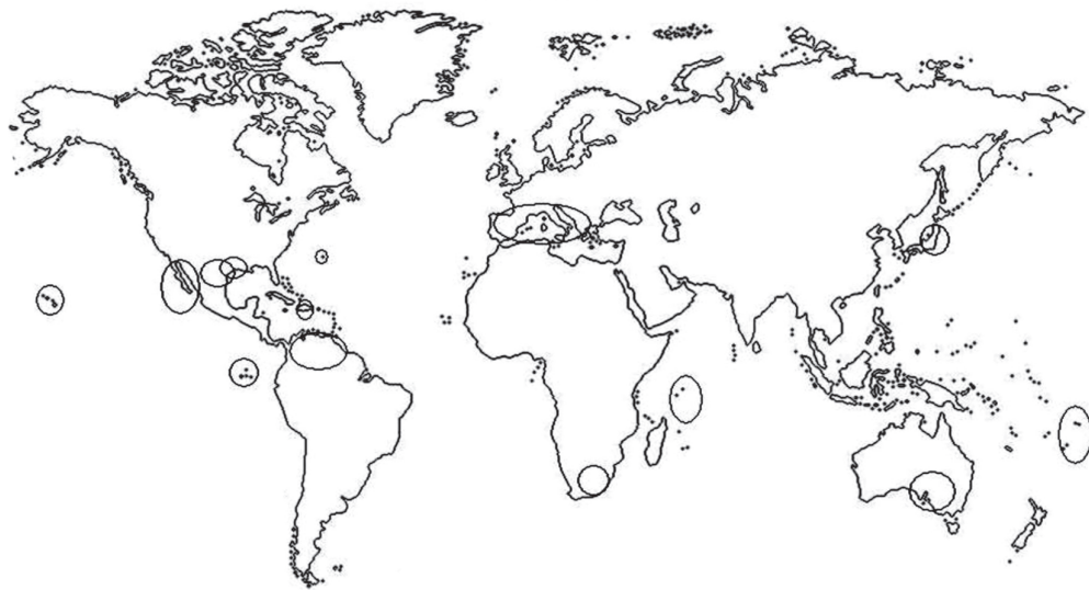
Figura 1. Territorios insulares y continentales colonizados por hormigas invasoras de acuerdo con las referencias en el texto.

Por su parte, S. invicta ha invadido áreas de las Antillas, África, Australia y Oceanía, incluida Hawaii [Davis et al. , 2001; Morrison et al. , 2004]. De manera particular Wetterer y Snelling (2006) la consideran la hormiga más perjudicial de Estados Unidos al provocar serios desequilibrios ecológicos, lo cual incluye la depredación de aves y reptiles [Holway et al. , 2002]. Por último, W. auropunctata ha provocado grandes perjuicios a la biota de las islas Galápagos, además de extenderse por otros grupos insulares del Pacífico y África Occidental [Loope y Krushelnycky, 2007].