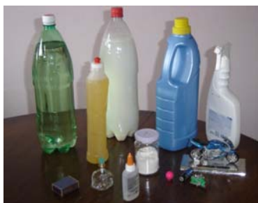
Figura 1: Fotos dos materiais utilizados em oficina com crianças