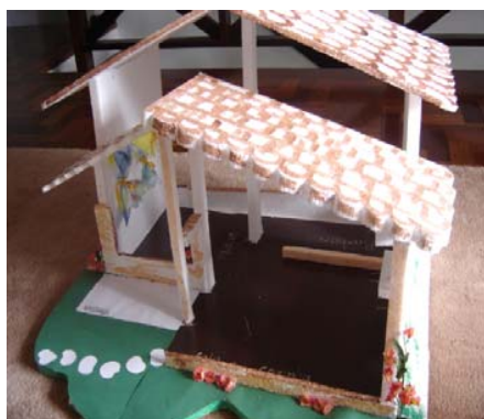
Figura 3: Foto da Casa Simulada