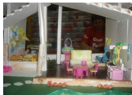
Figura 6: Foto demonstrando a colocação final dos móveis e utensílios