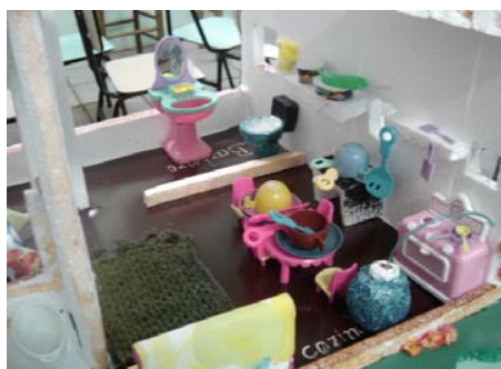
Figura 5: Foto demonstrando a colocação inicial dos móveis e utensílios