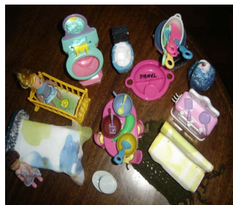
Figura 4: Móveis e utensílios colocados no saco surpresa