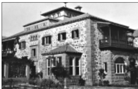
Sobriedad, elegancia, composición, detalles arquitectónicos. Vivienda unifamiliar en el Paseo de Chil en Las Palmas de Gran Canaria, 1921.