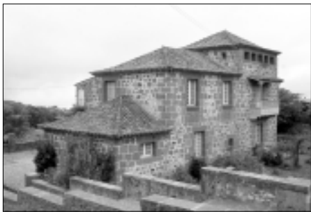
La «Casa Chica» o «Casa del Capellán» en el complejo arquitectónico de las Dominicas de Teror, que lo componen varias edificaciones.