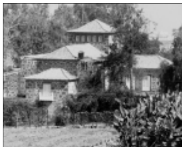
Edificaciones aisladas entre árboles y diferentes elementos para embellecimiento de fincas, muros y portones.

Conjunto arquitectónico de la Cuesta de El Reventón en Santa Brígida.