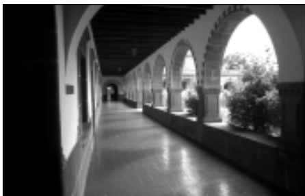
Claustro con arcos de medio punto en el edificio de las Dominicas de Teror.