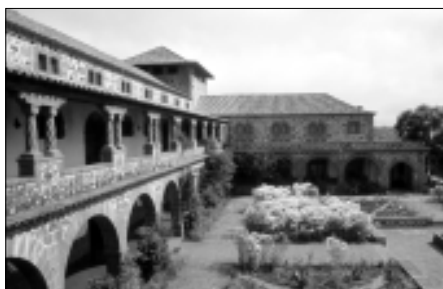
Vista general desde el patio interior del conjunto edificatorio de las Dominicas de Teror.