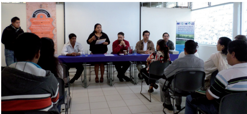
Figura 3. Inauguración del Diplomado en Mediación, Traducción e Interpretación en Lenguas Nacionales para Servicios Públicos, 2014 en DUVI-Grandes Montañas.

Desde el principio, con el Departamento de Lenguas y después de 2013 con el Área de Normalización Lingüística, la DUVI realiza diversas iniciativas que se dirigieron a crear un perfil profesional para el intérprete y traductor de lenguas indígenas, estando el caso de la traducción muy ligado con la elaboración de materiales educativos e informativos, y publicaciones. En asociación con varios organismos públicos como el Instituto Nacional de Lenguas Indígenas (INALI), la Academia Veracruzana de las Lenguas Indígenas (AVELI) y la Comisión Nacional para el Desarrollo de los Pueblos Indígenas (CDI), diseñó e implementó diplomas de interpretación en lenguas indígenas nacionales de cara a responder a la demanda de este profesional en los servicios de procuración e impartición de justicia. En sus planes de estudio no dejaban de contemplarse referencias a la traducción escrita, pero no ha sido hasta 2014 que la propia UV a través de la colaboración de la DUVI y el IIE, registraron el Diplomado en Mediación, Traducción e Interpretación en Lenguas Nacionales para el Servicio Público como un programa de educación continua (Figura 3).