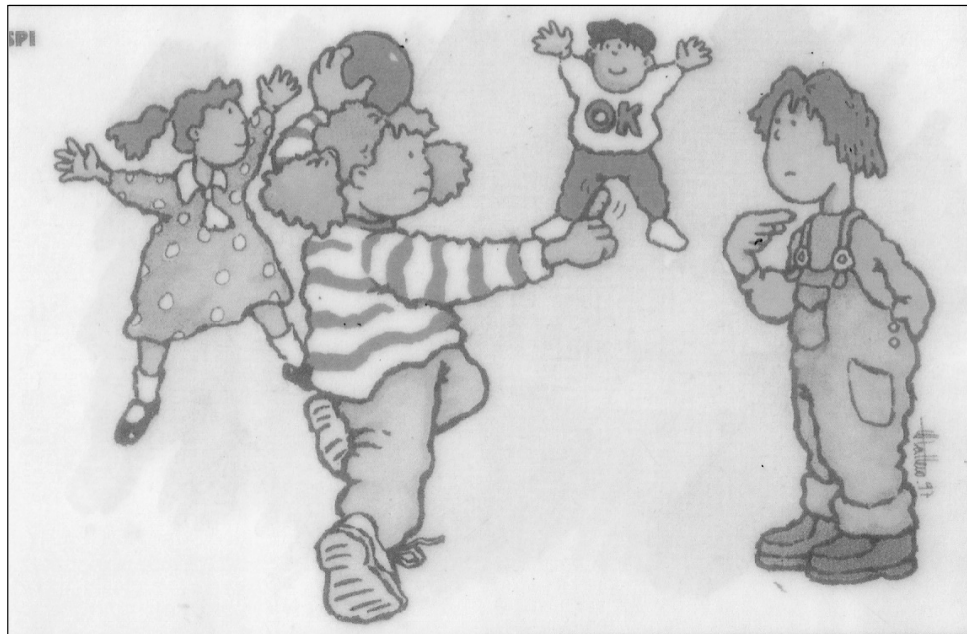
Figura A1. EVHACOSPI

Jorge se encontró a estos niños jugando a la pelota, pero cuando les preguntó si podría jugar con ellos, le dijeron que no. Entonces, se quedó mirándolos muy triste, porque no lo dejaban jugar.