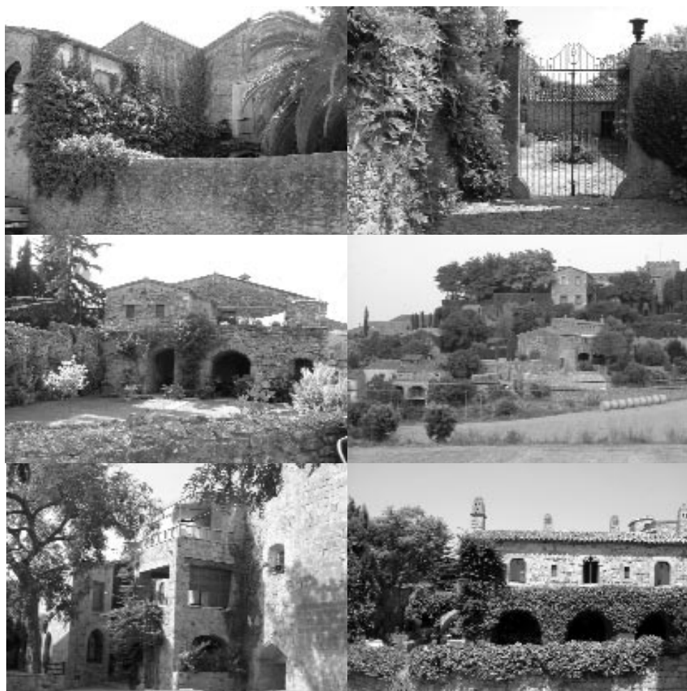
Diversos ejemplos de casas restauradas. De izquierda a derecha y de arriba abajo: 2 fotografías de Fonteta, Vulpellac, Foixà y dos últimas fotografías de casas en el centro de Pals. Fotos tomadas entre el 7 de julio y el 1 de agosto de 2004.

forma parte de la colectividad y de la identidad de los pueblos. Sin embargo, el crecimiento en forma de urbanización es visto como un desarrollo urbanístico "aislado" y a menudo, tal y como se planifica, independiente del resto del pueblo, no sólo en el sentido más físico del concepto sino también social. Ello provoca preocupación por los posibles efectos que puede tener en la anulación de los lazos comunitarios de la población que ocupa el territorio. A diferencia de la ocupación de masías y casas de pueblo, el fenómeno de la urbanización aparece como una perturbación a la estética del paisaje y de los pueblos.