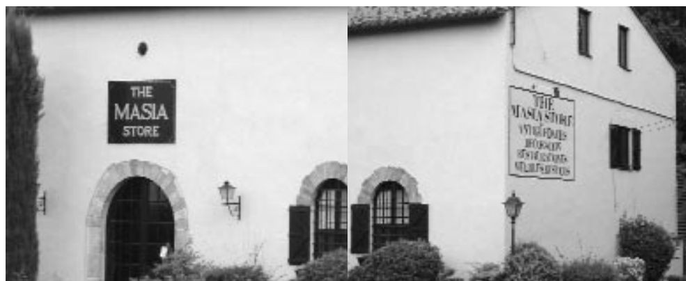
Dos imágenes de un mismo comercio destinado a vender mobiliario y antigüedades para la decoración de las masías y casas de pueblo que se restauran en esta zona. Foto tomada el 22 de julio de 2004. El comercio se localiza en la carretera que une Torroella de Montgrí con Girona y las autopistas, cerca de Rupió.