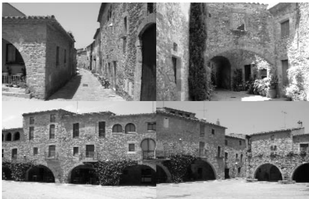
Monells, uno de los pueblos que ha experimentado los cambios que se describen en estas páginas con más intensidad. Diferentes tomas de las calles y de la que quizás es una de las plazas más famosas y emblemáticas de toda Cataluña. Fotos tomadas el 18 de julio de 2004.

Como se puede comprobar, estamos ante un tema de gran importancia y escaso conocimiento en nuestro país. El estudio de casos particulares, de ciertos municipios, puede ser de gran interés para abordar las estrategias de los diferentes agentes en este proceso de transformación social y de revalorización residencial en el medio rural. Monells podría constituir un buen ejemplo de dicho proceso de decadencia-revitalización. Prácticamente fue abandonado en los años sesenta, cuando la mayor parte de la población se trasladó a los municipios próximos de Corçà y la Bisbal d'Empordà, sedes de una pujante industria de la cerámica y de los materiales de construcción. El deterioro se agudizó con la llegada de población inmigrante con pocos recursos procedente de Andalucía, que ocupaba parte de estas casas a la espera de estabilizar y mejorar su situación económica con la perspectiva de poder acceder a comprar/alquilar una casa en la Bisbal d'Empordà. Posteriormente, la llegada de artistas, gran parte procedente del extranjero, que se instalaban en unas casas que prácticamente no valían nada revertió la situación de decadencia y abandono del pueblo, tendencia que ha continuado en la actualidad con la práctica rehabilitación de todo su parque residencial, lo cual lo ha situado como uno de los pueblos más apreciados y atractivos de toda la comarca, que se corresponde asimismo con el valor de sus viviendas.