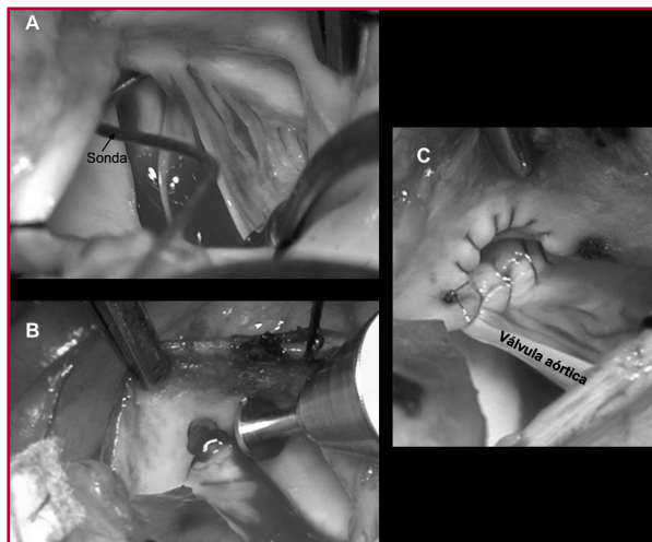
Fig. 1. Resección parietal o unroofing modificado. En A se aprecia la sonda que pasa a través del ostium coronario (con forma de hendidura). En B se observa la creación de la neoboca con forma redondeada. C. El proceso terminado.

En el período considerado fueron intervenidos quirúrgicamente 4.711 pacientes, de los cuales en 23 el OAAC