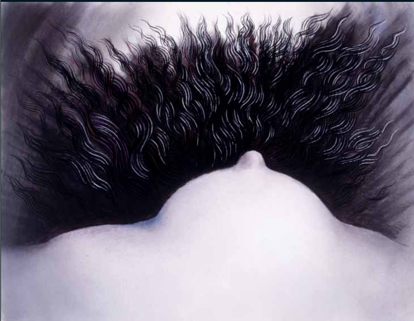
Demencia senil I. Lápiz y pastel, 98 x 127 cm. 2003.