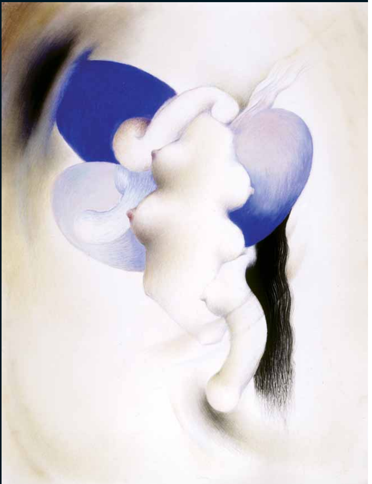
Demencia senil V. Lápiz y pastel, 127 x 98 cm. 2003.