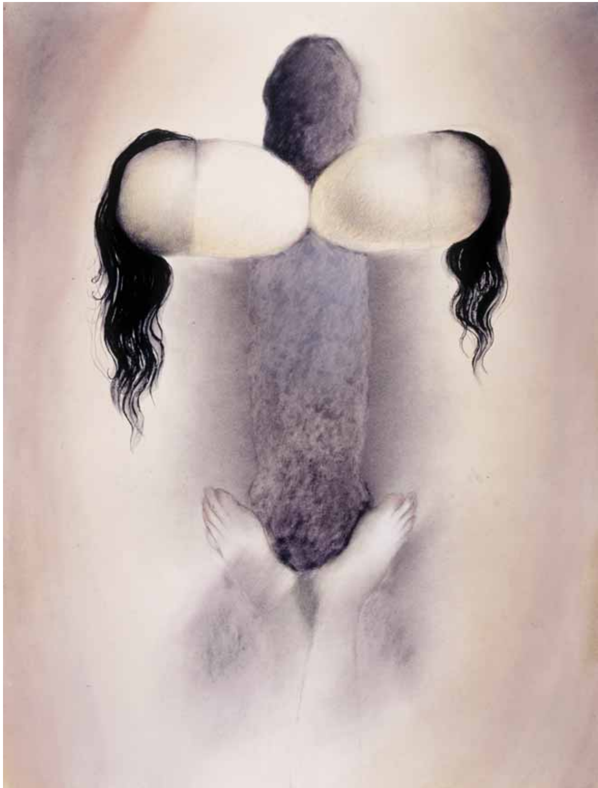
Fetichismo senil. Lápiz y pastel, 127 x 98 cm. 2003.