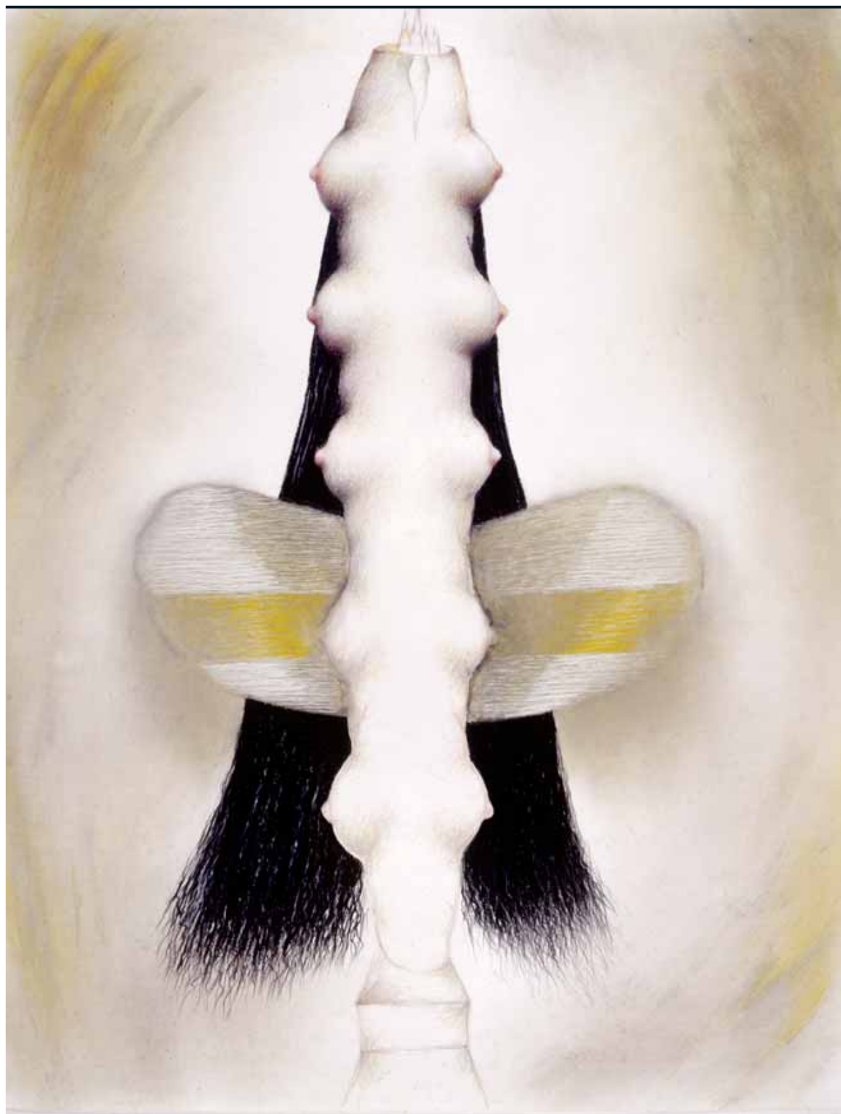
Demencia senil X. Lápiz y pastel, 127 x 98 cm. 2003.