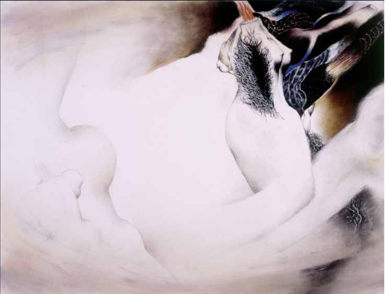
Paisaje senil. Lápiz y pastel, 98 x 127 cm. 2003.