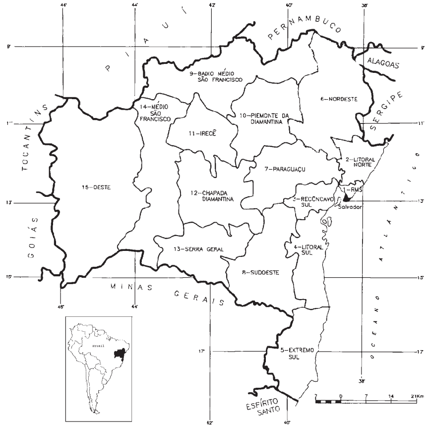
Figura 1. Localização da Chapada Diamantina dentro do estado da Bahia, Brasil.

A Área de Proteção Ambiental dos Marimbus/Iraquara situa-se na região orográfica conhecida como Chapada Diamantina e inclui os municípios de Lençóis, Palmeiras, Seabra, Andaraí e Iraquara, apresentando uma extensão de 125.400 hectares na área centro-norte do estado da Bahia (Anuário Estatístico da Bahia, 1997). A comunidade de Remanso (Figura 1) está 100% nela inserida e foi escolhida como local de estudo devido a sua localização (próximo à cidade de Lençóis, cujas coordenadas geográficas são 12°34'S e 41°23'W), seu isolamento relativo (o acesso à comunidade é feito por trilhas que atravessam a mata ou por uma precária estrada não pavimentada), sua diversidade em ecossistemas e em espécies animais, o pouco conhecimento bibliograficamente registrado a seu respeito e o grau de impactos sócio-ambientais a que está sujeita em decorrência do crescimento da atividade turística.