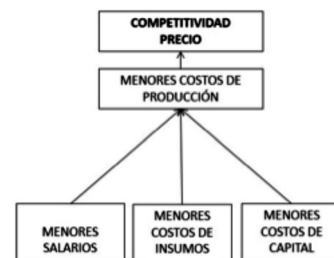
Figura 1. Bases de la competitividad precio-costo. Basado en Bianco (2007).

Dentro de la clasificación de los clústeres, aquellos formados