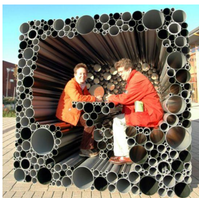
Fig. 4. Ideas innovadoras para el jardín. [11]

Así pues, intentamos tener una creativa descripción del comportamiento creativo/conservador de las distintas sociedades del planeta. La importancia de la memoria para lograr fuertes identidades y de la creatividad para lograr vanguardias culturales; y especialmente de las dosis exactas entre ellas, donde la memoria no se convierte en lastre del desarrollo, cualquiera que este pueda ser. Así como también, donde el cambio creativo no vaya arrasando con los rasgos culturales de las culturas.