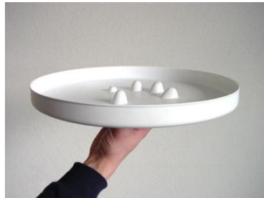
Fig. 1. Charola. [3]

Sin embargo, lo original, lo distinto y lo sorpresivo, dependen siempre del contexto en el que se da la respuesta creativa. El contexto, o Marco de referencia, es determinante. Como en muchas cosas, la creatividad es relativa a su contextualización, o marco de referencia. (figura 2).