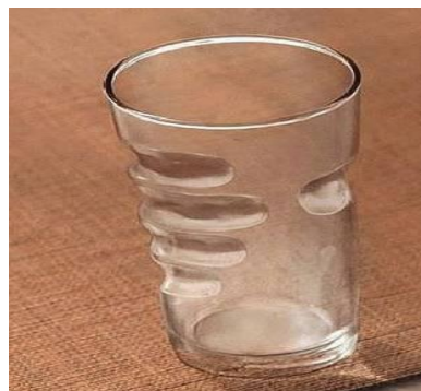
Fig. 2. Vaso ingenioso. [5]

“Lo que pasa por extraordinario lo es solo con referencia a algún ORDEN particular establecido entre las criaturas ya que, en cuanto al ORDEN universal, todo es perfectamente armonioso. Ello es tan verdadero que no solo no sucede en el mundo nada que se halle absolutamente fuera de la regla, sino que no se podría ni siquiera imaginar algo que sea tal.” [4]