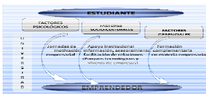
Figura 1 Proceso del aprendizaje emprendedor en las Universidades según los factores influyentes de Veciana

Los factores psicológicos hacen referencia al perfil de personalidad que debe poseer un estudiante para llegar a ser emprendedor, incluyéndose aquí la necesidad de logro o la búsqueda de independencia. Lo mejor que se puede hacer desde las universidades para favorecerlos son las jornadas sobre motivación empresarial. Dentro del enfoque sociocultural, o los factores socioculturales, se estudia la incidencia de factores sociales, políticos, económicos, familiares y, en especial, la influencia del apoyo institucional en la decisión del emprendedor de crear su propia empresa. Aquí la universidad tiene un papel institucional de apoyo en materia de información, asesoramiento y facilitación de relaciones para que los estudiantes desarrollen su idea. Esto suele hacerse desde los viveros de empresas o parques tecnológicos asociados a la Universidad. El enfoque gerencial enfatizaría en los conocimientos y habilidades adquiridas en el ámbito de la economía y la dirección de Empresas. Para mejorar este factor las Universidades deben incluir en sus planes de estudio, además de las materias típicas de cada titulación, otras formas de formación complementaria en materia empresarial, favoreciendo las habilidades de trabajo en equipo, pensamiento crítico o autoconocimiento continuado.