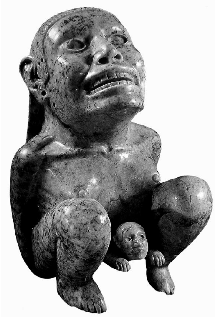
Figura 1. Diosa Tlazolteotl

Se muestra en cuclillas, postura que se acostumbraba en el parto. Aplita. 20.2 × 12 cm. Dumbarton Oaks Research Library and Collections. Washington, D.C. Tomado de Arqueología Mexicana , 2003, edición especial, núm. 13:70.