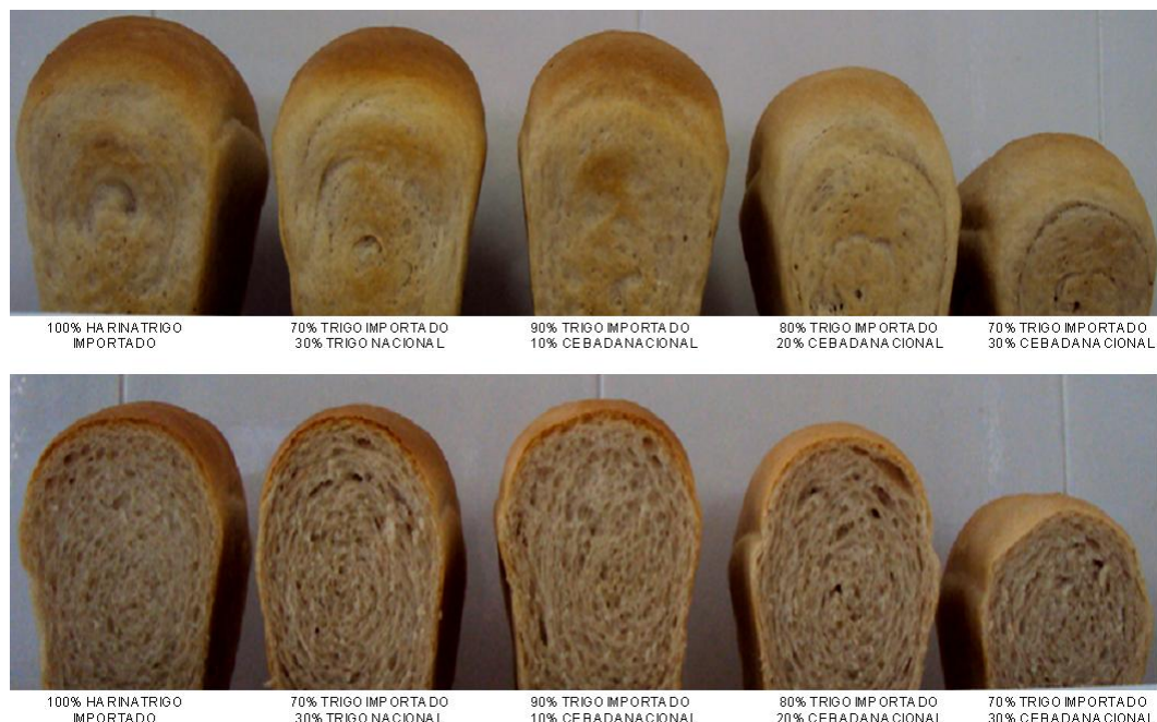
Figura 2. Panes elaborados con las diferentes harinas

*Letras diferentes en una misma columna indican diferencias significativas (Tukey, p \leq 0.05 ) en los diferentes panes.