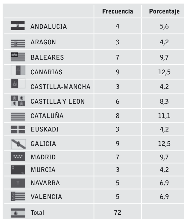
Tabla 2. Distribución de encuestados por comunidades

En la Figura 1 se observa los porcentajes generales de respuestas correctas e incorrectas a las preguntas de conocimiento. A excepción de la pregunta 1, que respondió correctamente el 67% de los encuestados, y la 5 con el 50 %, el resto de las preguntas no alcanza el 50% de respuestas correctas.