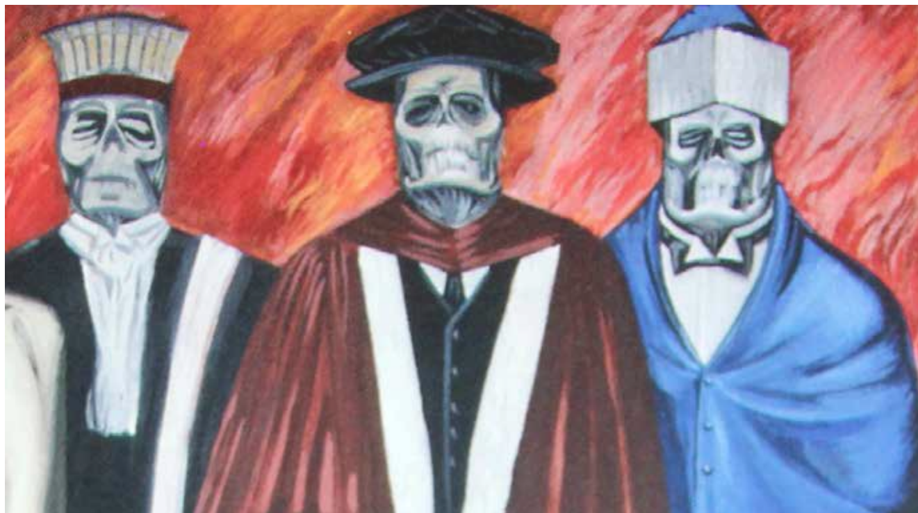
Ilustración 5. J. C. Orozco, American Civilization The Gods of the Modern Man, 1932, fragmento. Biblioteca Dartmouth College New Hampshire.

Parece existir una escisión instituida que permite a la mano derecha ignorar lo que la izquierda hace; utilizamos con malicia esta expresión coloquial. Pero esa etiqueta clínica, por evidente, nos deja sin alternativas de comprensión. Ignoramos cómo se pauta “implícitamente