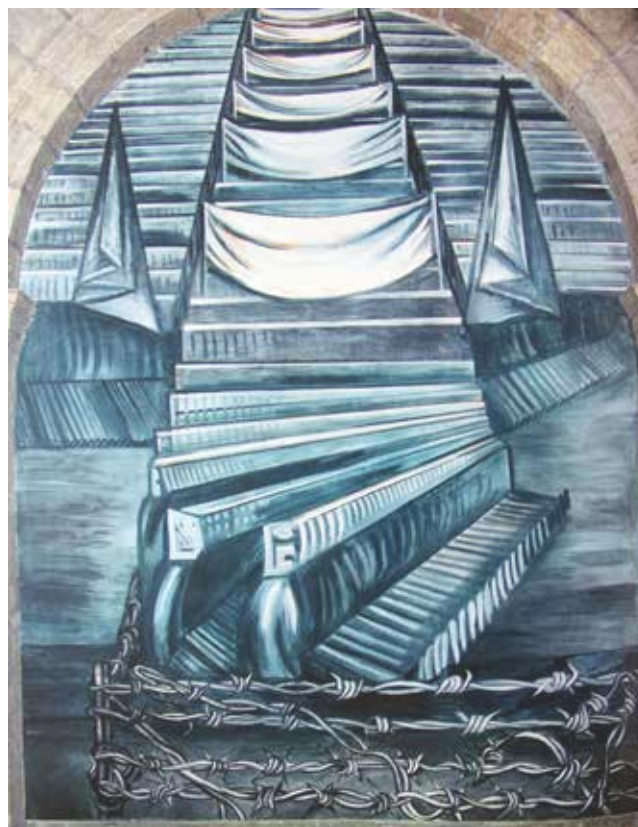
Ilustración 2. J. C. Orozco, Las Masas Mecanizadas. Hospicio Cultural Cabañas 1938-39, Guadalajara.

de la matrícula total (74% en la década 1960-1970) cursan las carreras de Medicina, Ingeniería, Comercio y Derecho. En los años posteriores a la reforma de los años setenta, el porcentaje de estas mismas cuatro carreras descendió hasta el 45% tal vez como uno de sus efectos.