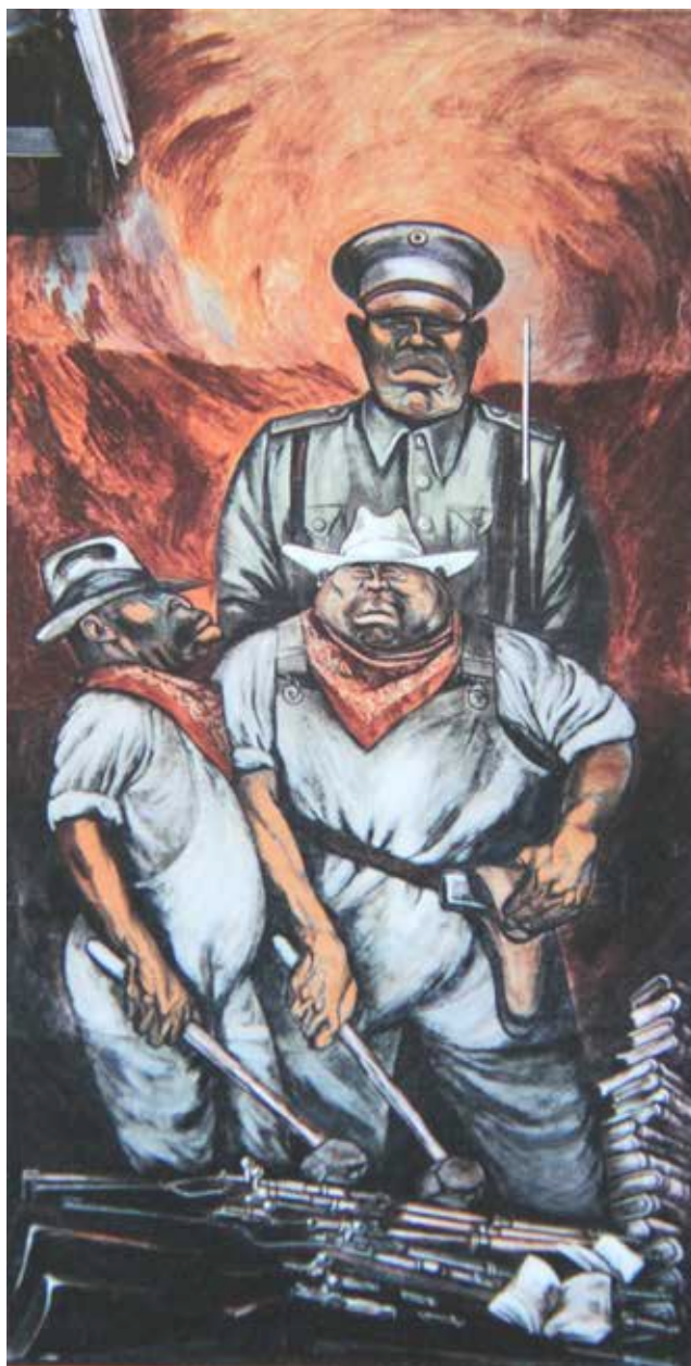
Ilustración 6. J. C. Orozco La rebelión del hombre Los Líderes, 1936. Universidad de Guadalajara.

Dos son las implicaciones de este argumento para el vínculo entre imagen y tiempo. La primera se basa en la relación permeable entre los significados lingüísticos de lo observado en la imagen dialéctica. Aunque ésta evoca un concepto asignado a un ícono; por el carácter de la pre-relación facultativa y transitiva, su significación no está determinada de una vez y para siempre. En la