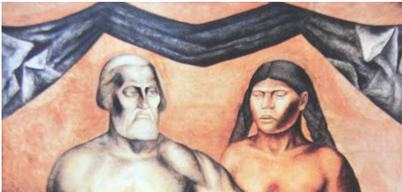
Ilustración 7. J. C. Orozco. Cortés y Malinche, fragmento. Escuela Nacional Preparatoria 1926, México.

ilustración 6 “La rebelión del hombre Los líderes” aunque fechada en 1936 en la preguerra, ilustra la bestialidad real que inspiró la frase acuñada sobre la FEG: “socialismo teórico, pistolero práctico” de 1949 a 1969. La segunda reside en que lo imaginario, siendo un flujo incesante de lo representativo, afectivo e intencional del ser humano en la medida que no es funcional, ni lógico, ni racional, está facultado para crear mediante una especie de tejido conjuntivo, de un “haz embrollado”, según metáforas de Castoriadis, desde el abismo sin fondo en que cada ser humano recubre al caos; es decir, su carácter poético, creador de significaciones. (Castoriadis, 1991). Así, pasamos de las autodefensas, organizaciones de raíz purépecha y modelo para la restitución de la dignidad secuestrada, a las guardias uniformadas y cómplices del cacicazgo negociador con el poder establecido.