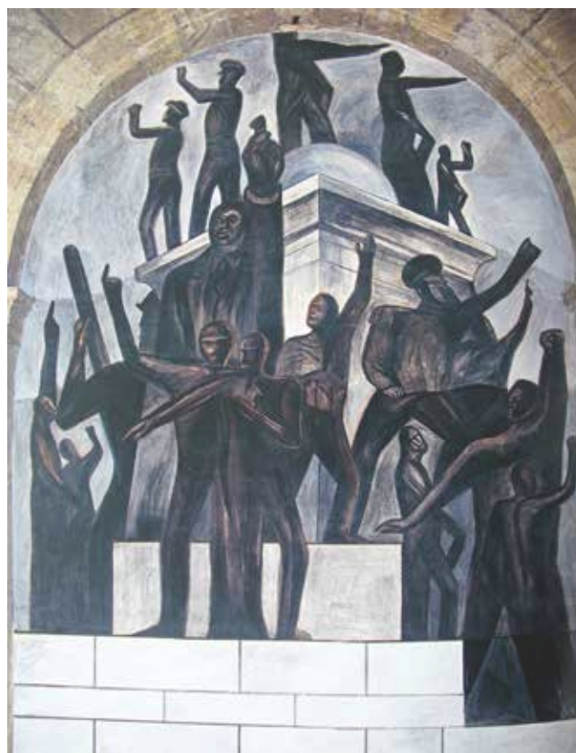
Ilustración 4. J. C. Orozco, Los Falsos Líderes. Hospicio Cabañas, 1938-39 Guadalajara.