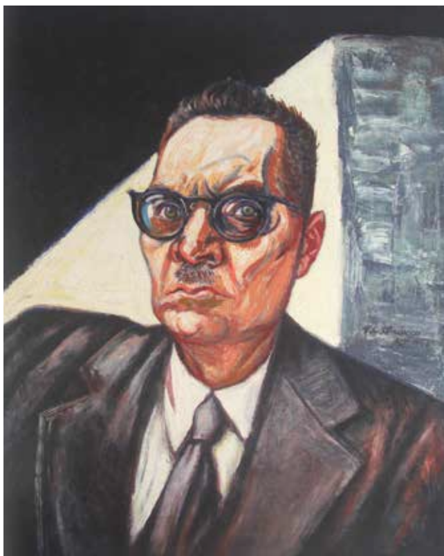
Ilustración 1. José Clemente Orozco Flores 1883-1949.