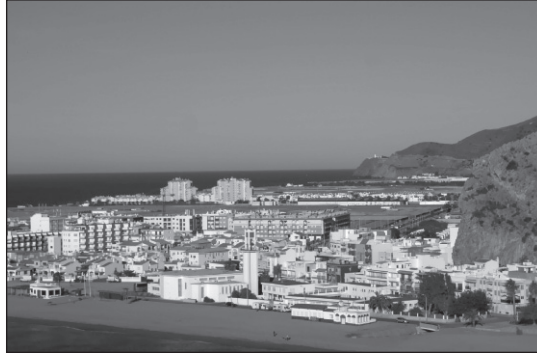
FIGURA 2. Carchuna-Calahonda (Motril), donde se puede observar la competencia por el espacio litoral entre los usos turísticos y agrícolas