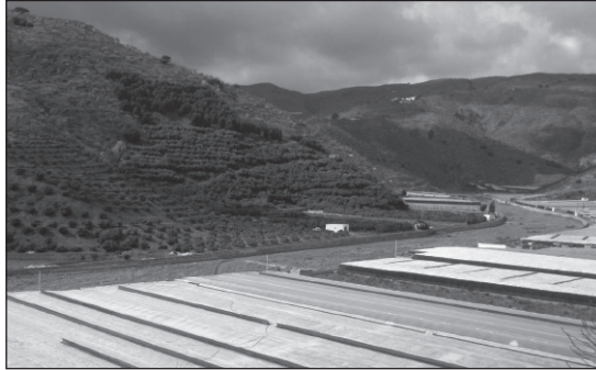
FIGURA 3. Imagen de la Rambla de Albuñol. Invernaderos (primer plano), tropicales (en frente), y hábitat y usos tradicionales en seco en las zonas de ladera (al fondo)