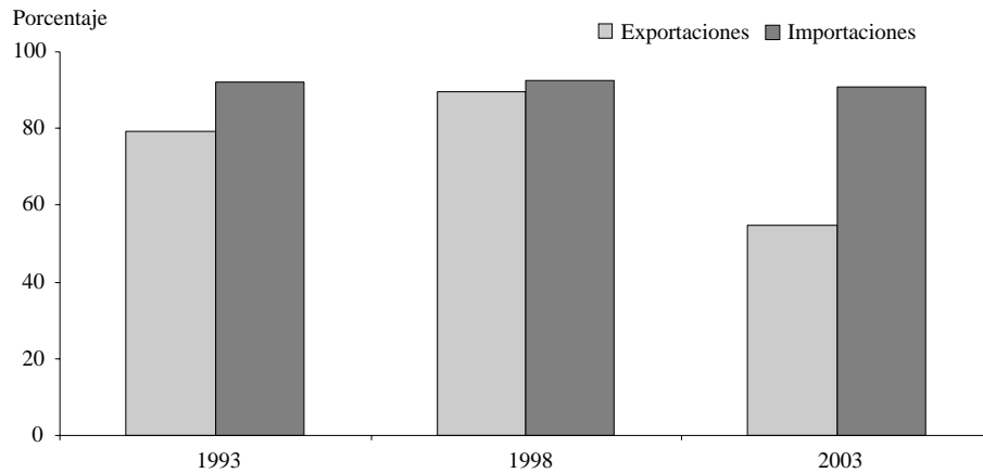
Gráfica 2 México: participación de Industria manufacturera en el sector externo, 1993-2003

Fuente: Elaboración propia con base en Banco de Información Económica .