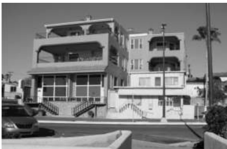
Fotografía 7. Casa-habitación (color amarillo) ubicada en el malecón

Por ejemplo, pescadores narraron sus experiencias de cuando de niños trabajaron en actividades relacionadas con el turismo. Lo anterior es interesante ya que, aún cuando existe cierto consenso de que el “boom” turístico inició a mediados de los noventa, el turismo siempre ha estado presente en Puerto Peñasco. Historias de turistas llegando a la comunidad por tren con sus pequeños botes de pesca deportiva y su equipo pesquero son comunes.