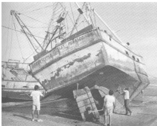
Fotografía 1. Niños limpian y pintan la cubierta del barco pesquero