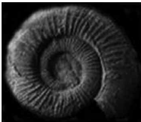
Molusco Ammonites mineralizado.

Rotación de las asas intestinales sobre el eje de los vasos mesentéricos que simulan la forma de la concha mineralizada de un molusco del grupo de los Ammonites.